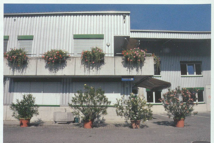
Liebevoll gepflegte Landschaft der Verzweiflung: Asphaltpflanzen im Werdenberg.