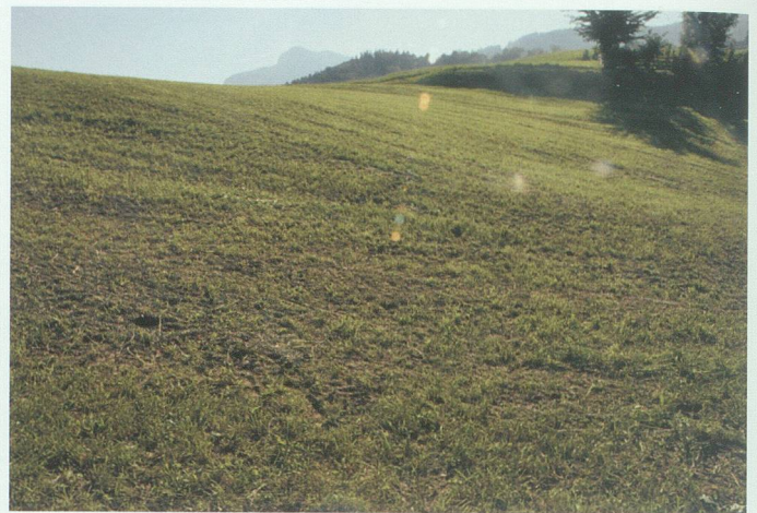
Die Wüste Weide: die moderne humusarme Landwirtschaftsbrache – zu oft gemäht, zerkaut, überdüngt.

Energiebedarfs. 3 Wegen ungelöster Sicherheits-, Entsorgungs- und Versorgungsprobleme sowie eklatanter Unfallrisiken bringt auch die Atomenergie keine Hoffnung. Nur erhöhte Effizienz, Minderung des Energieverbrauchs und ein massives Hochfahren der erneuerbaren Energieerzeugung können hier helfen.