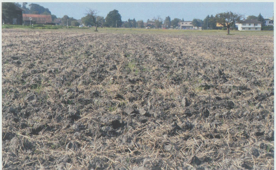
Endstation Monokultur oder Beginn einer neuen Praxis? Gerade im kleinteiligen Werdenberg kann Anbau klimaaktiv werden.

Energie zu erzeugen, Wasser zu konservieren, zu filtrieren und zur Wiederverwendung aufzubereiten. Es gilt, nicht nur ohne externe Stromzufuhr auszukommen, sondern sogar Energie für die Gemeinschaft zu produzieren.