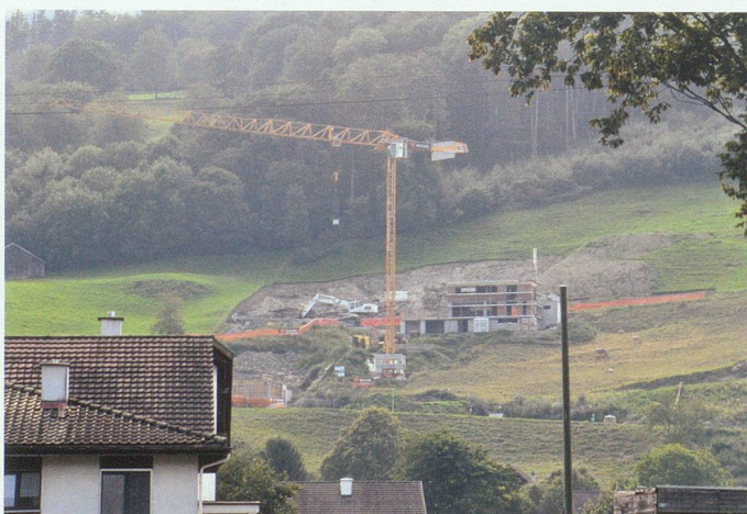
Das Bild zeigt, wie die Siedlung im Werdenberg in Gefahr ist, sich weiter und weiter auszudehnen: Hangbebauung.

der Flur oft fehlplatzierten, flachdächigen Bauten versuchen sie, aus dem grossen Katalog der Baumaterialien und mit modischen Formen neue Gebilde zu schaffen, bereit für den nächsten regionalen Architekturpreis oder für ein Titelblatt im Baujournal. Heute heisst es aber, die Schönheit nicht im Einzelkampf der Bauformen zu suchen, sondern sie wieder tief in der Land- und Siedlungskultur und deren Produktivität zu verankern. Die Basis für unser Leben bilden nun einmal der Boden, das Wasser und die Artenvielfalt – und gesunder Boden bedeutet Artenvielfalt. Viele Weiden sind heute verarmt. Anstelle von tiefer, humusreicher, von Mikrobewesen wimmelnder Erde fin-