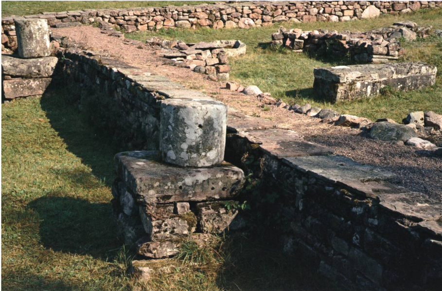
Das burgundische Kloster Annegray war Columbans erste Klostergründung auf dem Kontinent, um 591. Überreste der Grundmauern der hochmittelalterlichen Kirche, rechts oben ein frühmittelalterlicher Sarkophag.

mehr als 200 Jahre seit ihrem Tod vergangen. Verwunderung weckt auch die Tatsache, dass aus dem Iren Gallus nun sogar ein Königssohn wird, dessen Vater wie Gallus selber praktisch ein Heiliger war. Was ist schliesslich von der Ankoppelung des Gallus an die Familie der heiligen Brigida zu halten?