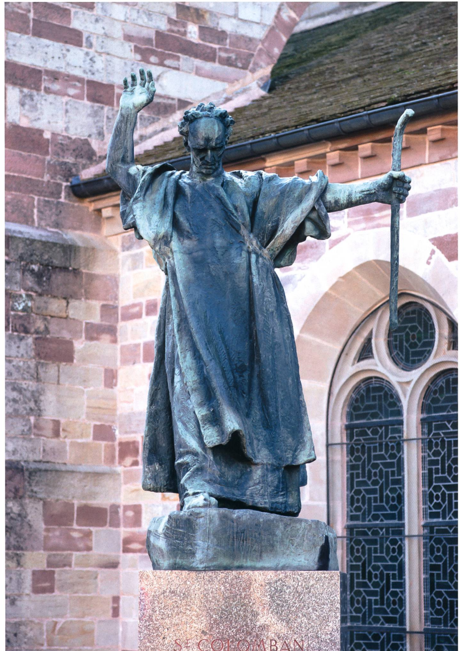
Luxeuil-les-Bains: Bronzestatue von Columban, 1936, vor der Abteikirche Saint-Pierre. Luxeuil war die zweite Klostergründung Columbans im Frankenreich; ab hier lässt sich der Lebensweg von Gallus verfolgen.

men? Callech soll er auf Irisch geheissen haben. 48 Diese Form wurde «gelegentlich von irischen Worten, die übersetzt Milch oder aber Hahn (altirisch cailech , heute coileach ) bedeuten würden», abgeleitet. 49 Einen anderen Weg hat Heinrich Zimmer eingeschlagen. Nach ihm ist irisch Gallech als Adjektiv zu verstehen, das soviel wie lateinisch Gallicus