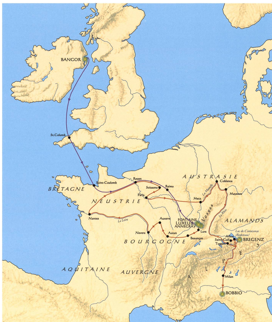
Die Reiseroute von Columban und Gallus. Columban: von Bangor bis Bobbio. Gallus: von Luxeuil bis an die Steinach.

Dass Wettis erstes Kapitel Anlass zu Zweifeln gibt, zeigt auch der Vergleich mit Lebensbeschreibungen, die konkrete Nachrichten über die Kindheit und Jugend ihrer Helden enthalten. Zu ihnen gehören die Columban- und die Otmar-Vita. Von Columban erfahren wir zahlreiche, offensichtlich persönliche Details aus seiner Zeit in Irland. So hören wir beispielsweise von einer Lehrerin und einem Lehrer des Knaben, die beide mit Namen genannt werden, oder von den dramatischen, nicht topischen Umständen bei seiner Trennung von der Mutter. Wir erhalten konkrete Angaben über ein von ihm verfasstes Buch sowie schliesslich über das Kloster, in das er eintrat. 10 In den wenigen Zeilen, die Walahfrid über den jungen Otmar verfasste, finden sich nicht weniger als sechs glaubwürdige Informationen: über die Herkunft des späteren