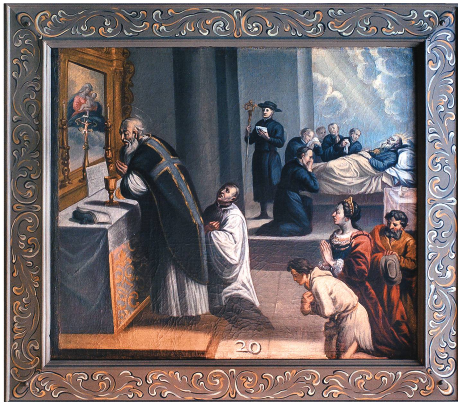
Gallus liest für Columban die Totenmesse. Tafel 20 aus dem Bilderzyklus in der Galluskapelle in St.Gallen, um 1760.

Die Bedeutung des Namens ist klar. Wie wir uns erinnern, hat auch ein Bischof aus dem Namen Gallus die Grundbedeutung 'Hahn' herausgehört. Darauf nimmt noch die gegen 900 entstandene Vita des heiligen Magnus Bezug. Als dieser, in Analogie zu Gallus in Bregenz, den Luftdämonen in Kempton gebietet, den Ort zu verlassen, heulen sie: «Wehe, was werden wir nun tun? Einen andern Hahn haben wir hier! Dieser ist ja noch schlimmer als der erste [Gallus].» 110 Bemerkenswert ist ferner, dass der Hahn gelegentlich auch als Attribut des Heiligen erscheint: so auf der Predella des linken Seitenaltars in der ehemaligen Kloster-