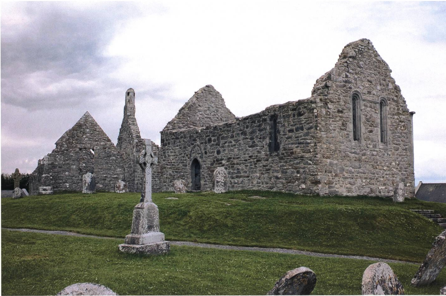
Clonmacnoise, eine Klosteranlage in Irland, die ihre Blütezeit zwischen dem 6. und 12. Jahrhundert erlebte.

floh Reichtum und Reich seines Vaters, nahm die Pilgerschaft auf sich und vollbrachte in Gallien viele Wunder. Er kam in das äusserste Germanien und starb in ausserordentlicher Heiligkeit. Wenn du aber seine weiteren Wunder kennenlernen willst, so lies seine Lebensgeschichte 24 und du wirst alles erfahren.»