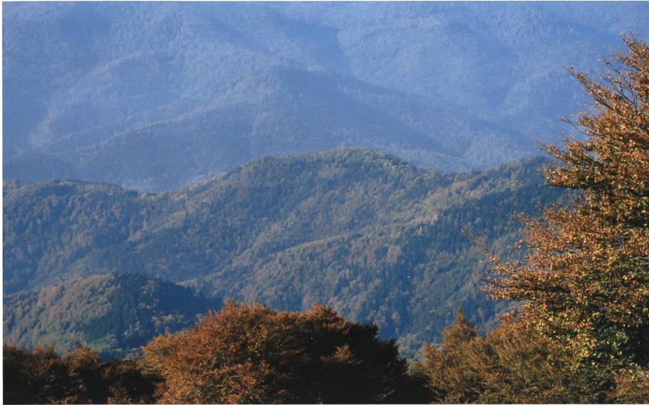
Hügellandschaft in den Vogesen: Vieles spricht dafür, dass Gallus im Raum Vogesen-Elsass aufgewachsen ist.

nach dem Tod des Abtes Eustasius gekommen war, um das einstige Mitglied des Klosters zum neuen Abt zu berufen. Wetti verwendet dabei folgende Formulierung: sex fratres ex Hiberniensibus comitibus 61 – «sechs Brüder aus seinen irischen Gefährten». Walahfrid schreibt: sex fratres ex his qui ab Hibernia venerunt – also: «sechs Brüder von denen, die aus Irland gekommen sind». 62