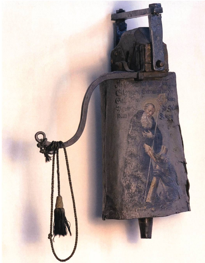
Die sogenannte Gallusglocke aus Bregenz, seit 1786 in St.Gallen in der Stiftskirche.