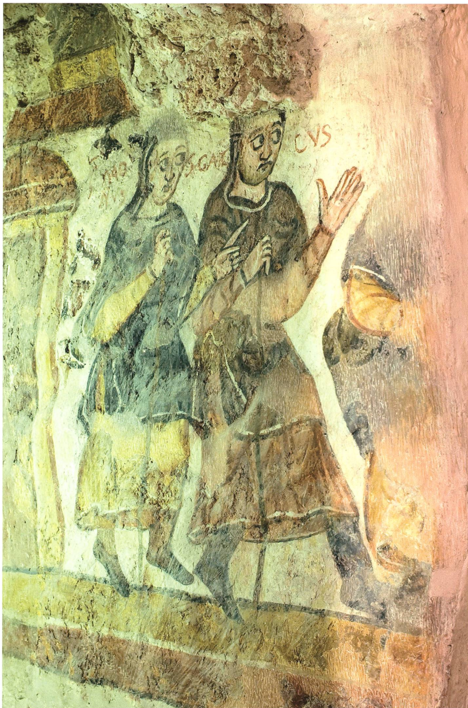
Magnus-Krypta in Füssen: Magnus folgt Gallus, «Reichenauer Schule», um 980.

Im öffentlichen Bewusstsein ist vor allem das eine haften geblieben, dass die Herkunft des Gallus umstritten sei. Ja, die Frage der Herkunft des Namensheiligen von Stadt, Kanton und Bistum hat die übrigen Themen des Galluslebens weitgehend verdrängt. Es ist die Frage, die mir bei Vorträgen und in Gesprächen über den einstigen Einsiedler am häufigsten gestellt wird. Offenbar liegt vielen St.Gallern, vor allem den