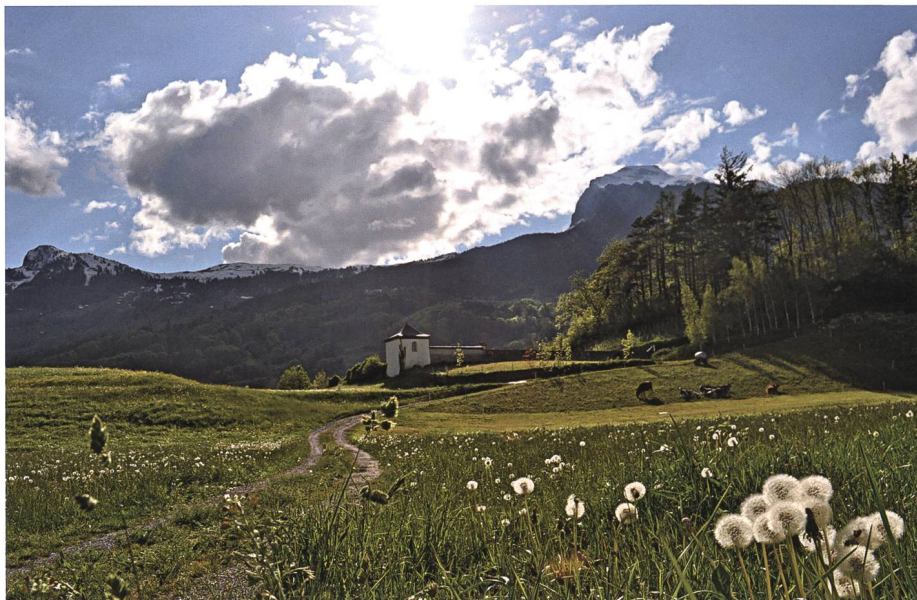
Gapluem gegen Chappili, Pfrundwingert und Pfarrersbüel: Fünf eingebrannte Finger im Schaufelstiel erinnern an den Marchenrücker.

«Du, Jässi, steh auf, as pörrat ain an der Huistür – es poltert jemand an die Haustür!», ruft die Neasi auf Sabarra in Oberschan ihrem Mann zu un git am ai's mit am Ellaboga-n in d Ripp – und versetzt ihm einen Rippenstoss, «steh auf!» « Hou », bröolat der Jässi, « was