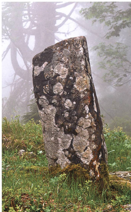
Grenzmarch aus dem Jahr 1569 in Hinderelabria: Jahreszahl auf der Vorderseite, Kreuzzeichen an den Schmalseiten sowie dem «Wartauer-Ringgen», dem Hoheitszeichen der Gemeinde, auf der Rückseite.

Maa n wandern, bis er erlöst wird. Oft ist das Erscheinen der Geister und Wiedergänger, die diese Freveltaten zu sühnen haben, mit Glut und Feuer verbunden; sie brennen teils lichterloh, so dass man durch die Rippen hindurchschauen kann – vielleicht als Symbol für die Hitze des Fegefeuers, worin die Täter bereits geschmort haben. Man hüte sich deshalb, deren Hände zu ergreifen, wenn sie zum Dank für die Erlösung gereicht werden; man halte ihnen statt dessen einen Holzstock, ein Scheit oder einen Werkzeugstiel hin. Als Teil des schon vom Fegefeuer Ergriffenen erscheint die Hand dann darin eingebrennt. Redet man sie an, so müssen sie Rede stehen, wer ihnen aber das erste Wort lässt, dem ergeht es übel. Im Allgemeinen können diese Sünder erlöst werden, da sie im Sinn der «armen Seelen» jene Gestalten sind, die sich zwar selbst nicht helfen können und Lebende um Hilfe zur Erlösung angehen