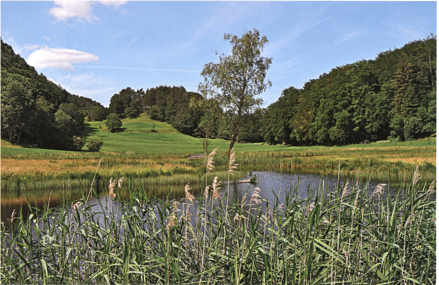
Schaner See gegen Mangis und Termbüchel: Der Marchenbrenner im Plana hauchte hier sein Leben aus.

und ihn die Beine nicht mehr tragen wollen. Er wehrt und sperrt sich; aber alles nützt nichts, er torkelt in die Glut wie eine Mücke ins Licht. Er will sich wieder erheben, findet keinen Stand; er will sich überall halten an den brennenden Ästen und an den Wurzeln – sie aber lassen sich biegen und brechen. – «Fürio, Hüfio!»