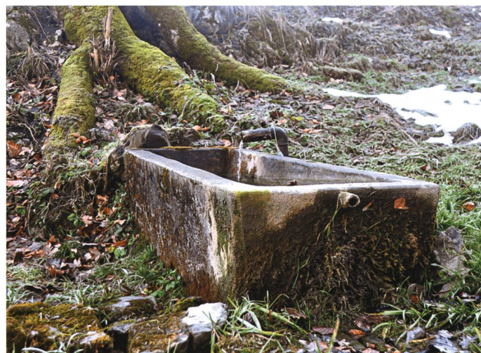
Alter Tränkebrunnen im Selfa: Handelt es sich vielleicht um das versiegte Goldbrünnlein am Brögstein?

Als sie am Morgen ihre Schürze ausschüttelte, sah sie mit Schrecken, dass der Kohlestaub golden war und ein paar winzige Körnchen baren Goldes sich in den Fäden verfangen hatten. Das schreckte sie auf. Wie ein Reh eilte sie zum Fuss der Tunggelgass zurück, jedoch waren weder Kohle noch Gold mehr zu finden!