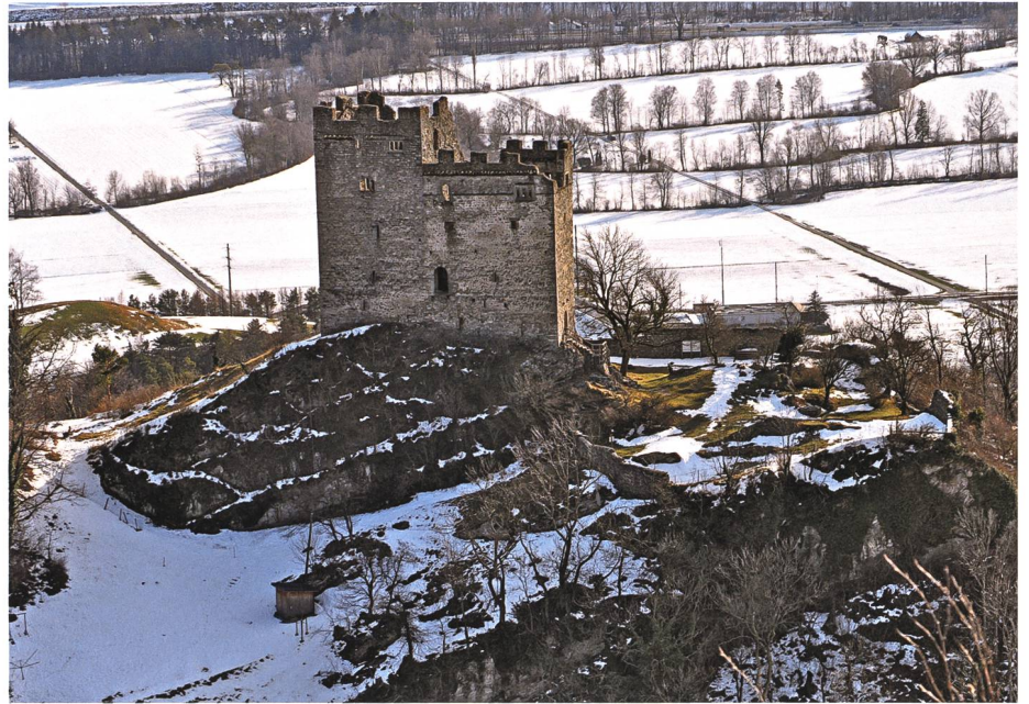
Burghof der Ruine Wartau: Blätter der einst dort wachsenden Blutbuchen verwandeln sich in lötiges Gold.

Seit Jahrhunderten waren Vorstellungen, wie man zu einem nie leer werdenden Geldbeutel kommt, wie man einen Geist oder den Teufel dazu zwingen kann, Geld zu geben, oder wie man einen Spiegel herstellt, in dem man im Boden vergrabene Schätze zu entdecken weiss, Bestandteile der Volkskul-