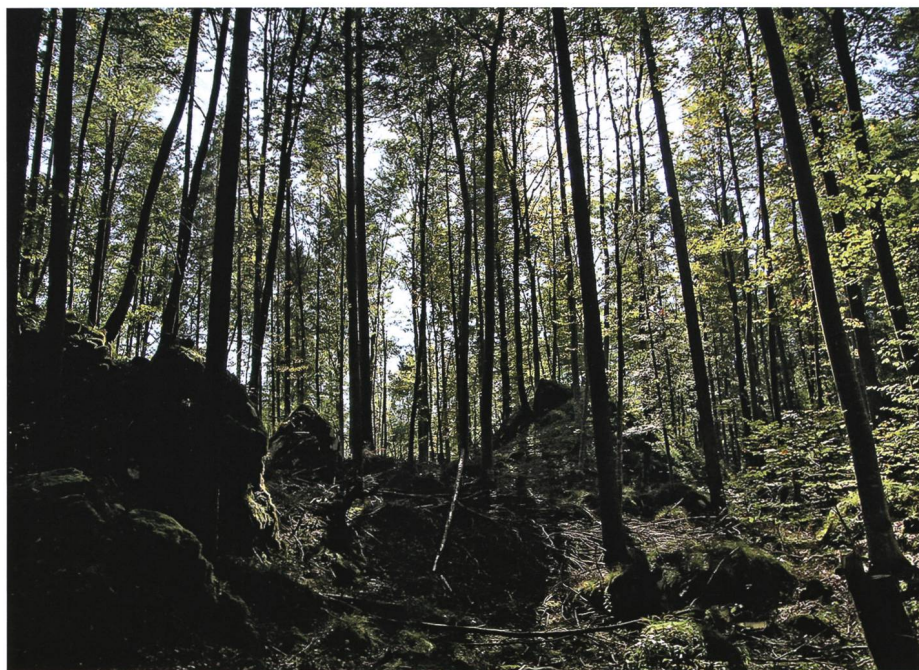
Im Salezer Schlosswald bei Forstegg war einst die Musik der Bergmännchen als Bergklingeln wie von silbernen Glöcklein zu hören.

Doch kaum hatte er geniest, wurden die Zwerge unruhig und fingen an, durcheinanderzulaufen, ganz so, wie die Ameisen in einem Tannennadelhaufen, wenn man mit einem Stock dreinstösst. Und dann begann es von fernher und dann immer näher zu donnern, und mit einem Mal gab es einen fürchterlichen Donnerschlag. Der junge Freiherr von Hohensax, der – zu Tode erschrocken – zusammengefahren war, fühlte sich gepackt. Er wurde von einer unsichtbaren Macht wie von einem Wirbelsturm herumgerissen, durch Felsklüfte geschleudert und schliesslich ins Wasser geworfen. Schwimmend hielt er sich über Wasser, bis er in einem schwachen Schein, der aus unendlicher Weite in die schauerli-