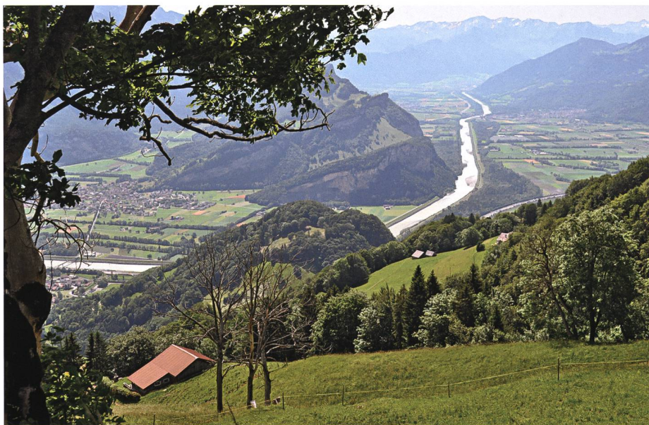
Beim Berggut Palz am Walserberg gegen Maziferchopf und Ellhorn: Das Grestamannli half als geschickter Wundarzt einem verunglückten Bauern.

Jetzt bemerkt das Mannli auch, dass der Tis nicht nur müde ist, sondern immer wieder pi n schtat – leise stöhnt –, tiefer atmet, auf die Zähne beisst und die Stirn in Falten zieht. Dann sieht es den Umschlag über dem Stiefel. « Was hänn er? Sinn er u n gfeelig gsi n ? – Habt ihr Unglück gehabt?» Der Tis bejahte es und erzählte, was geschehen war. Das Mannli nahm das Schmutzläch 17 und leuchtete ihm ins Gesicht. «Ja, ist der Chirurg noch nicht hier gewesen? Ihr seid ja noch angezogen. Dieser Umschlag nützt gar nichts. Das kann man so nicht lassen; es könnte den Kalten Brand 18 geben. Man muss die Stiefel und die Hose ausziehen.» «Nein, nein, o jee, um Gottes Willen, lasst mich liegen. Ich habe heute Nachmittag schrecklich gelitten!», klagte der Tis. Der Kleine aber beruhigte ihn und befahl der Frau, einen Sack mit Buchenlaub zu füllen und es fest hineinzupressen. Dann löste er die Schuhbündel und trennte die Hosennaht auf. Der Tis staunte nicht schlecht, wie sorgfältig und umsichtig er dabei voring. Die Frau kam mit dem Laubsack, und das Mannli drückte einen tiefen Graben hinein. Dann zog es ihm behutsam die Hosen und die Stiefel aus und bettete das knütschat haiter blou angelaufene Bein in den Graben im Laubsack und machte ihm darauf den Umschlag, wie es die Sursay-