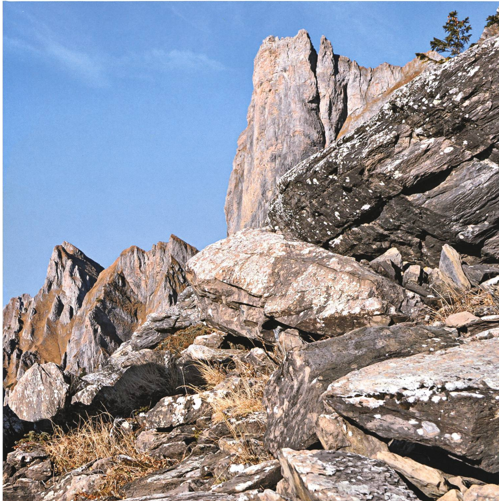
Die Welt der Wildleute: Fels und Stein in den Geröllhalden oberhalb vom Mürli im Hinderpalfris gegen Chrummenstein und Chlin Fulfirst.

ber beim alten bleiben, und sie seien gut damit gefahren. Was die Christen predigten, sei alles zwar recht, und wenn sie sich danach hielten, könnte man es auch annehmen: Aina sei gschtorba, ass dia andara nid müossen und läben – einer sei gestorben, damit es die andern nicht müssten und leben? Was soll das denn Besonderes sein? Das würden sie doch alles jeden Tag machen, wenn es nötig sei. Bei ihnen sei das einfach Brauch und Sitte, nicht Gebot und nicht Gesetz!