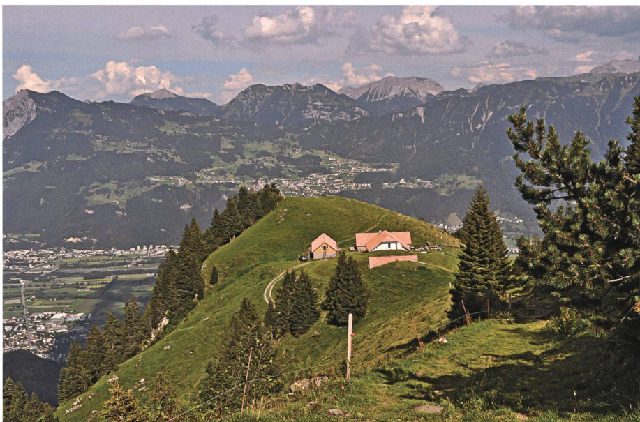
Gansbüel gegen Stofel und Schäfler auf der Schaner Alp: Ein fauler Senn verfluchte die besten Milchkräuter und verübte weitere Schandtaten.

Jetzt forderte das Mannli seinen Lohn. Das Paar Strümpfe hatte das Anni schon längst gestrickt; sie passten ihm wie angegossen. Als aber neben den Strümpfen auch noch ein Paar kleine Schuhe standen, machte das Mannli zu-