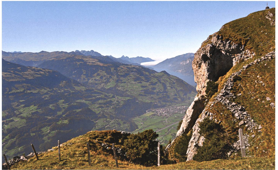
Böse Fellinen am Tschuggen gegen das Seeztal.

Als man zur Alp fuhr, trug es einen mächtigen Sack voll Farn 24 mit sich für seine Schlafstätte und einen dünnen Stock aus Haselholz. Man lachte, dieser Knirps werde nicht lange hirtten, bar- fuss! Vor allem der Senn hät en gür uf der Mugg ka n , hät gmupft un köglat un gschpitzt – liess sich über das Mannli aus, mupfte, stichelte und spitzte. Aber das Hirtchen tat, als merke es nichts, machte seine Sache wie am Schnür- chen, nid mit Fluocha-n un Chogna, mit Brügglä, mit Drii n schluu n un Plütscha, nai n , mit der Miattäscha, mit Logga, mit