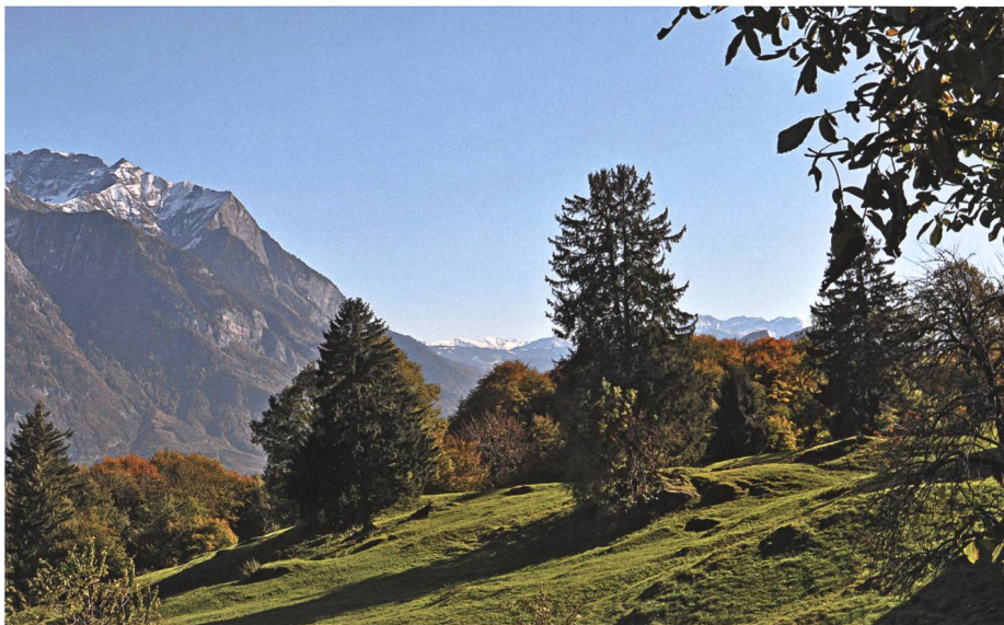
Auf Paschinis, wo im Juni und Juli die eiskalte Quelle fließt, wenn die Wilde im Brueschenloch oben weint.

Es war früher üblich, dass man von Anfang November bis nach Weihnachten das Vieh auf dem Maiensäss versorgte, bevor man es wieder zu Tal trieb und dort weiterfütterte, bis man mit ihm im Mai wieder zu Berg und später dann zur Alp fuhr. Die anfallenden Arbeiten auf den Maiensässen erledigten meistens jüngere Burschen, die für rund zwei Monate allein am Berg blieben und dabei oft von Langeweile geplagt wurden. Das Vieh war eben bald besorgt, auch wenn man es gut striegelte und sauber bürstete, für den wenigen Käse und die Butter brauchte man kaum Zeit, und holzen und scheiten war auf Dauer auch a bitzili hölzig . Freilich, solange es die Schneelage zuließ, konnte man zu den Nachbarn gehen, um etwas Kurzweil zu haben mit Geschichtenerzählen und dem Aushecken von Bubenstreichen. Aber es blieb