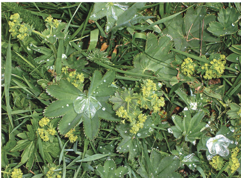
Der Berg-Frauenmantel ( Alchemilla monticola ) mit den fast ständigen Wassertropfen auf den Blättern hiess bei den Wilden «Sintou».

Zahlreiche Sagen aus dem Alpenraum thematisieren nicht nur den Viehraub, sondern auch soziale Spannungen zwischen den Bauern und dem Alpperso-