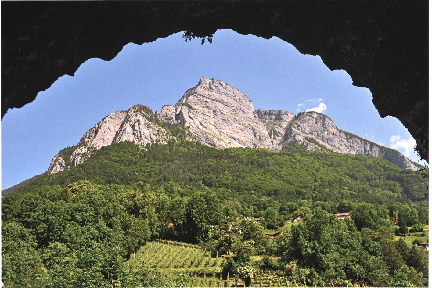
Die alten Gruben (Erzlöcher) am Gonzen befinden sich rechts über dem Wald unterhalb vom Gitziwang.

jenen Gruben waltete das Bergmannli, ein wohlthätiger Berggeist, der jede Gefahr rechtzeitig ankündete. Ungefähr um 1850 war ein Knappe mit seinem Bruder in der sogenannten Lehmgrube auf einem hölzernen Gerüst über einem schauerlich tiefen Schacht am Arbeiten. Da fing es an, kleine Steine nach ihnen zu werfen, anfangs ganz sachte, dann aber immer toller, so dass sie es endlich für ratsam hielten, den Werkplatz zu verlassen. Kaum waren sie an einem sicheren Ort angelangt, stürzte das Gerüst unter schrecklichem Gepolter in die grauenhafte Tiefe.