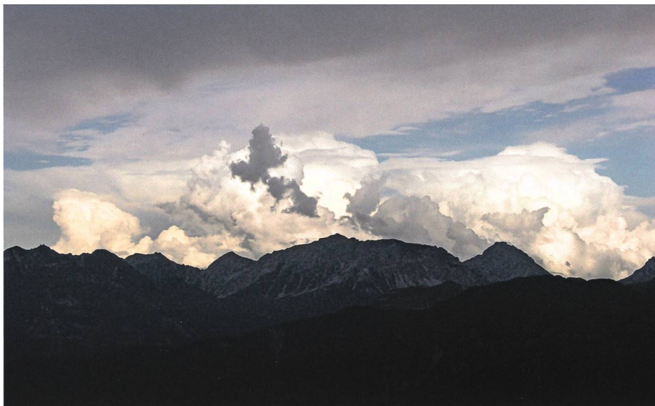
Wodans Heer oder die «Wilde Jagd» zeigt sich – vom Chamm her beobachtet – im Gewittersturm über dem Rhätikon.

Ainersch mol goot s djuss in d Tür – pumm-pumm! – Plötzlich pocht es laut, und als die Tür aufschwingt, steht der Gröhüetler leibhaftig da. An der Särta