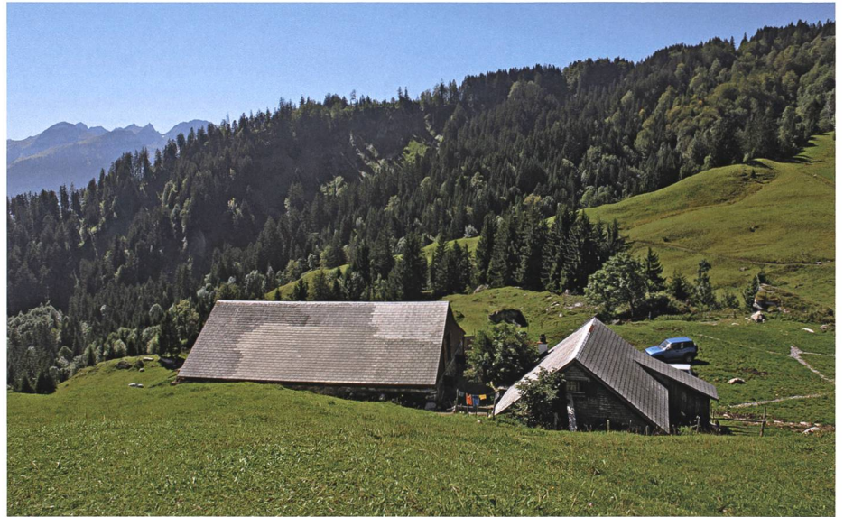
Die Gebäude der Gamser Alp Loch. Hier ist es ein geheimnisvoller Jauchzer, der den Wetterumschlag herbeiführt.

Früher hiess es, dass auf der Obetweid nach der Alpbefahrt noch weitergesennt werde. Es wäre dann ein übermütiger, lärmiger Betrieb in der Hütte, es würde getrunken, gelacht und gejast. Irgendwann wollte ein Gamser Genaueres darüber erfahren und stieg in einer Herbstnacht zur entleerten Alp hinauf. Gegen Morgen kam er ganz verstört wieder ins Dorf zurück, und jeder