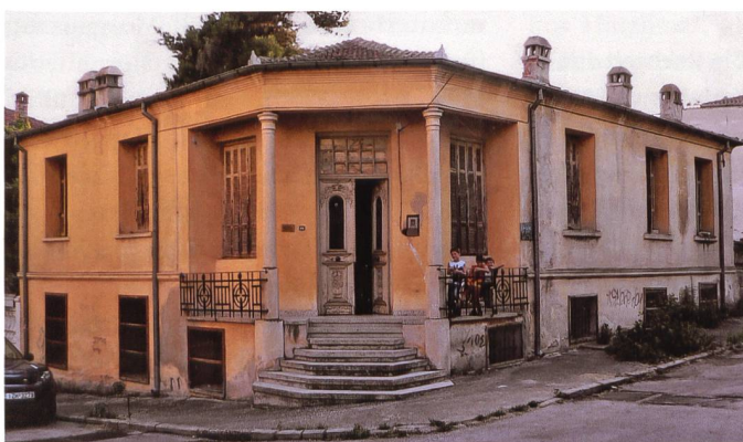
Nach der Vertreibung aus Trabzon liess sich die Familie Pelagidis in Drama nieder. Das stattliche Haus steht für die kaufmännische Seite Griechenlands.