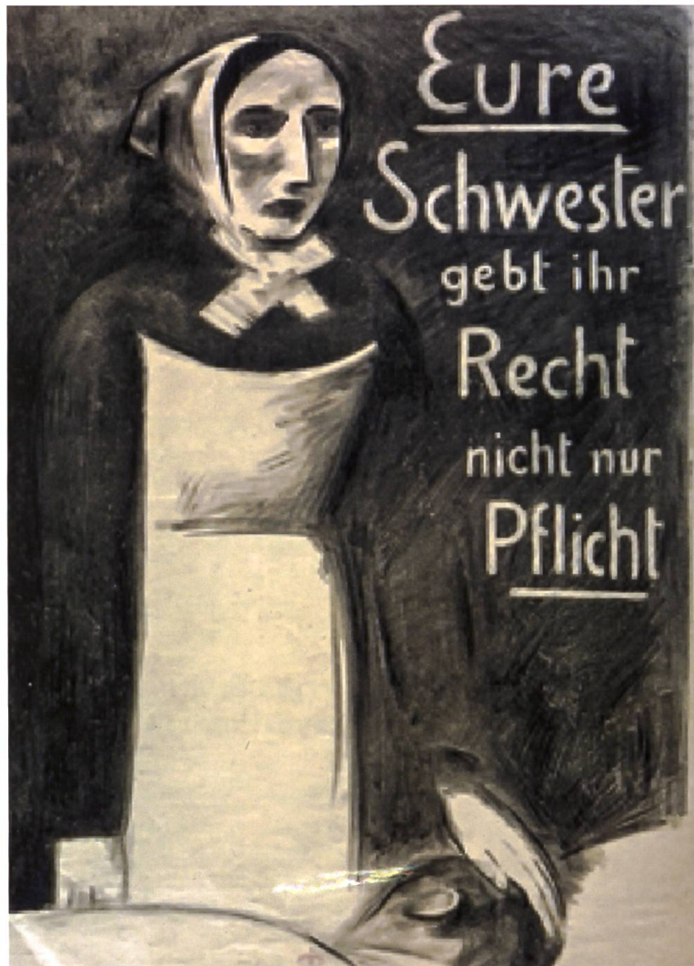
In den meist emotional geführten Diskussionen um das Frauenstimmrecht ging die rechtliche Argumentation nach Carl Hilty oft unter. Plakat von Pellegrini 1920.

Diese Kritik erinnert auch daran, dass ein Teil der bürgerlichen Frauenbewegung nur als Sittlichkeitsbewegung für moralische und gesellschaftliche Integration und bessere Lebensbedingungen eintrat, nicht aber für die politische Gleichberechtigung. 25