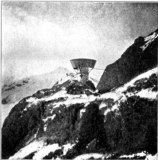
Fig. 3. Mougins-Totalisator am Konkordiaplatz (2850 m), erstellt von der schweizerischen Landeshydrographie.

samten Niederschlagsmenge beträgt. Dieser Ausfall wird sogar grösser, wenn, wie dies bei den Apparaten am Lammbach der Fall ist, das Metall im Innern des Apparates lackiert ist, denn die Wassertropfchen rieseln langsamer an einer lackierten Fläche als an glattem Metall. Die von der Landeshydrographie mit diesen Apparaten erzielten Resultate sind indessen nicht verloren; es wird genügen, den konstatierten Irrtum durch Vergleiche mit einem Mougins-Apparat zu korrigieren. Im allgemeinen dürfte es angebracht sein, diese Rohre durch Apparate nach System Mougins zu ersetzen, um so mehr als nach gemachten Beobachtungen die Rohre am Lammbach sich leicht teilweise verstopfen, infolge eines an der Öffnung sich bildenden Schneezapfens. Dieser Nachteil fällt beim Apparat Mougins, trotz seiner gleich grossen Öffnung, weg.