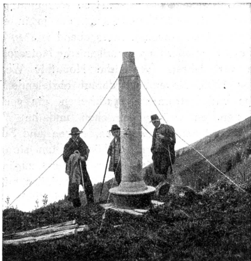
Fig. 1. Vallot-Rohr am Lammbach (1700 m)

Der Apparat Mougin ist im Grunde lediglich eine Abänderung des von Herrn Vallot, Direktor des Montblanc-Observatoriums, vor etwa 10 Jahren konstruierten Apparates. Da in den oberen Höhenlagen Stürme nicht selten sind und der Fall eintreten kann, dass durch Wirbelwinde der in den Behältern angesammelte Schnee herausgeweht wird, ist Herr Vallot auf die Idee gekommen, ein Rohr von 0,08 m Durchmesser an der Öffnung, 2 m Länge und 0,20 m Durchmesser in der Mitte, anzubringen. Er verwendet dieses Rohr in seinem Observatorium „des