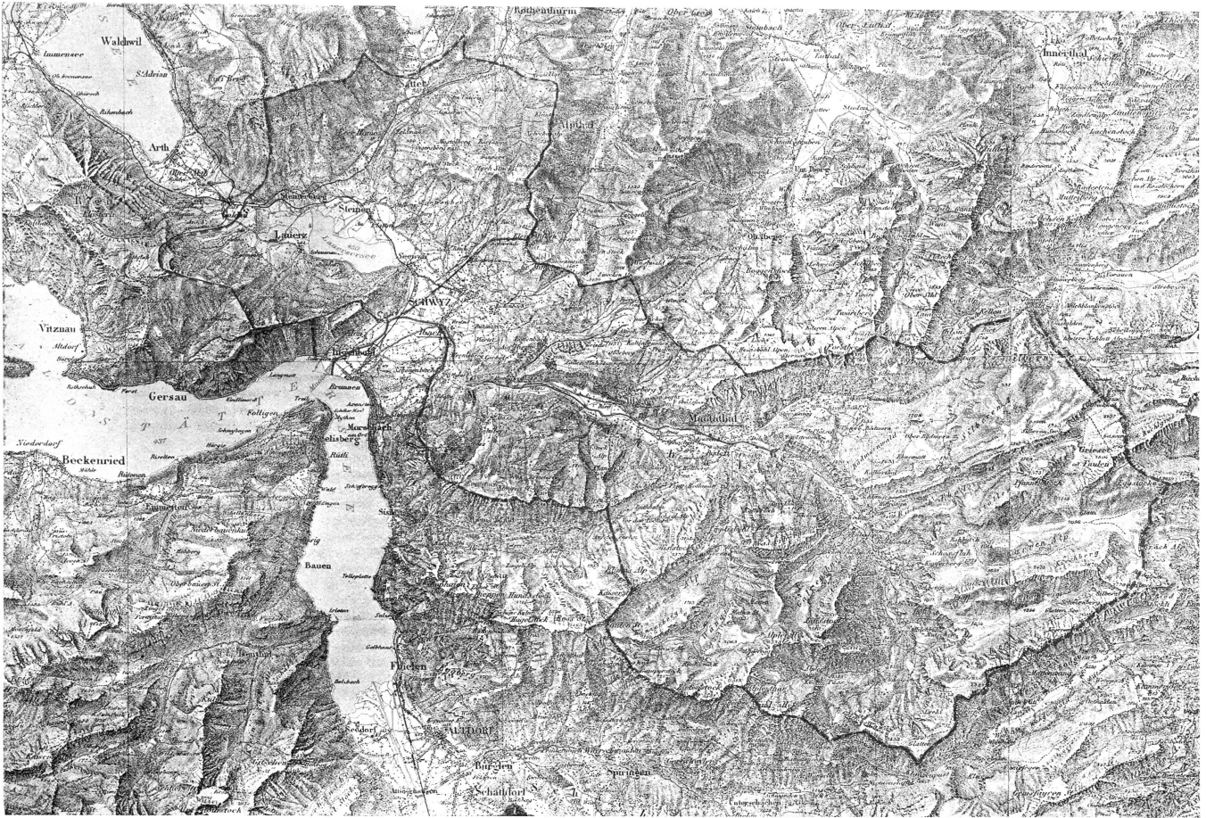
Die Muotakorrekion. Abb. 1. Einzugsgebiet der Muota. 1:150,000

Reproduktion von 1:100,000 mit Bewilligung der schweizerischen Landestopographie