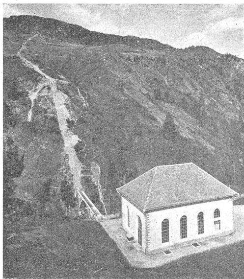
Abb. 2. Heidseewerk, Ansicht der Zentrale und Druckleitung.

Die grosse Trockenperiode des Herbstes 1920 zählt unstreitig zu den interessantesten Episoden der Witterungsgeschichte unseres Landes. Diesseits wie jenseits des Rheines ward durch ihr Dasein die Energieversorgung auf eine harte Probe gestellt. Ihre lange Dauer von Anfang Oktober bis Dezemberbeginn fiel gerade in die Zeit, da unsere hydroelektrischen Centralen ihre grösste Wirksamkeit entfalten sollten. Strichweise war die Niederschlagsarmut so intensiv, dass die umfangreichsten Wasser-