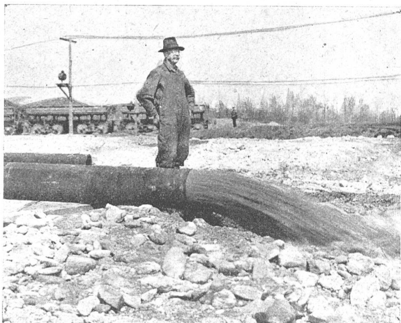
Abb. 14. Austritt der Schwemm-Masse beim Englewood-Damm. Im Vordergrund grösste, von Druckwasser noch mitgeführte Steine.

Weitaus der Grossteil der Installationen, die während des Baues dieser Dämme errichtet wurden, hat die Ingenieure des „Miami Conservancy Districtes“