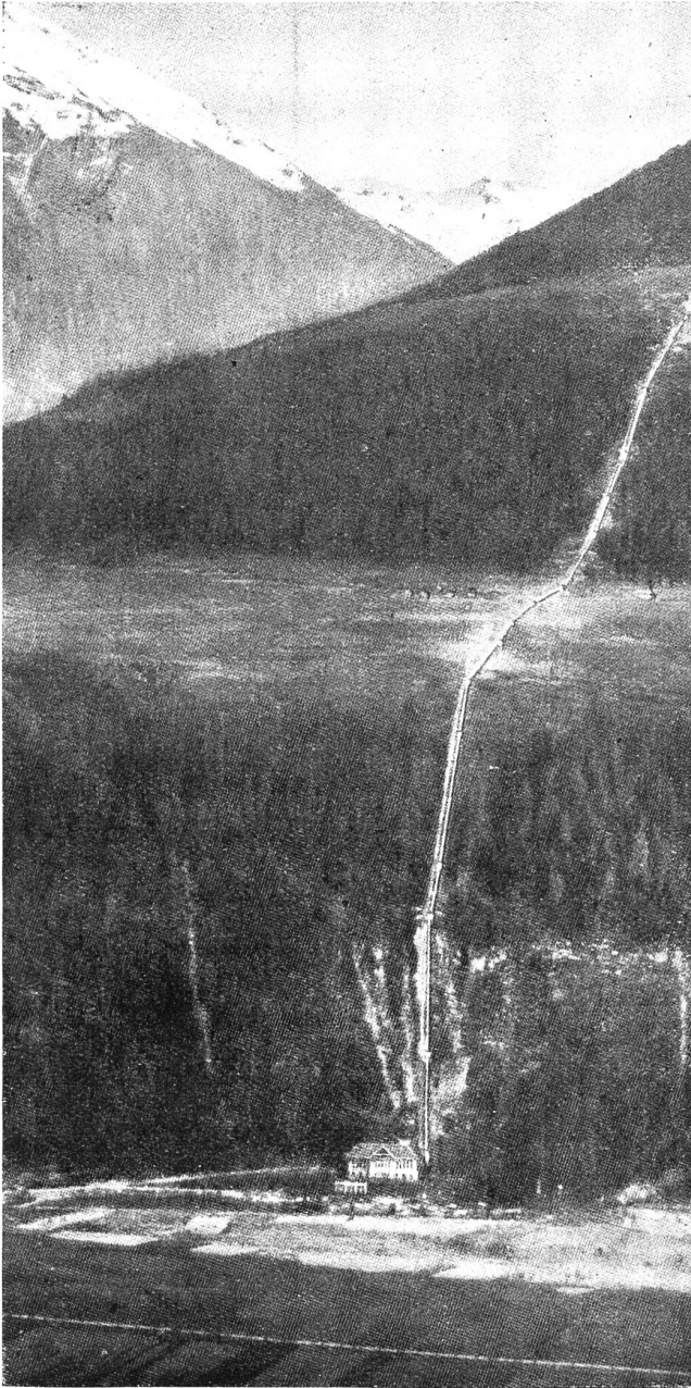
Abb. 8. Illsee-Turtmann. Druckleitung und Zentrale Turtmann.

Millimeter sich verjüngt. In dieser sind vorläufig zwei Maschinen-Einheiten von zusammen 20,000 PS Maximalleistung aufgestellt. Neben der Zentrale ist eine Freiluft-Transformator- und Schaltanlage angeordnet, in die auch die Energie des Illseewerkes eingeführt wird. Eine Hochspannungsleitung überträgt den Strom von 60,000 Volt an die Aluminiumwerke in Chippis.