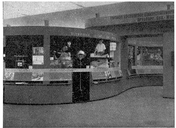
Die sanfte Windung zwingt den Beschauer zur Betrachtung.

der Halle für Arbeits- und Gewerbehygiene untergebracht. Als Grundlage der Ausstellung wurde der Lebenslauf des Menschen vom Säugling bis zum Greis genommen, in folgende Hauptabschnitte eingeteilt: Das Kleinkind, das Schulkind, der Beruf, die Schönheitspflege, der Haushalt, die Gesundheitspflege, der Arzt, die Erholung. Es wurde darauf geachtet, daß die elektrischen Geräte in Beziehung zum Menschen stehen, und versucht, Wiederholungen von Geräten möglichst zu vermeiden. Im ganzen sind 125 elektrische Geräte von 30 verschiedenen Firmen ausgestellt.