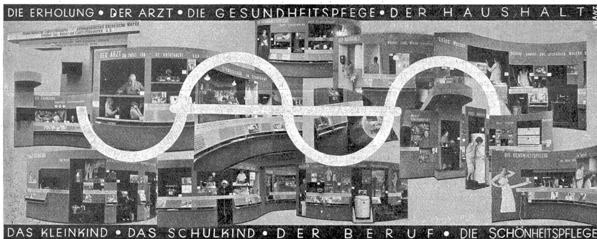
Die Elektroschau an der Internationalen Hygiene-Ausstellung in Dresden 1930.

Die Elektrizitäts-Ausstellung trägt den Titel „Elektrizität im Dienste der Hygiene“ und ist in