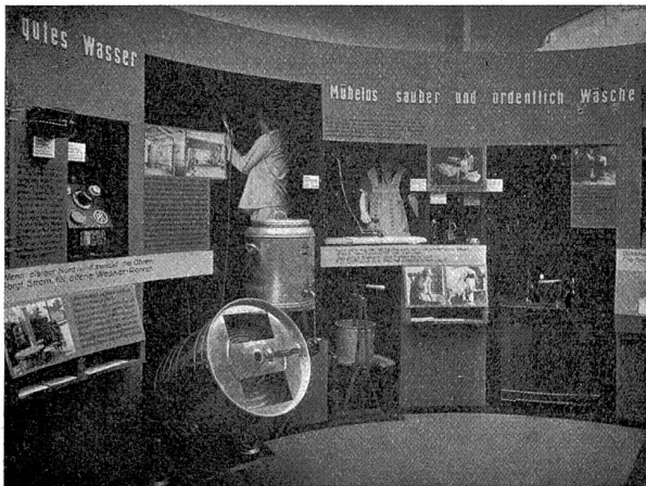
Elektrische Hygiene bei der Wäscherei.