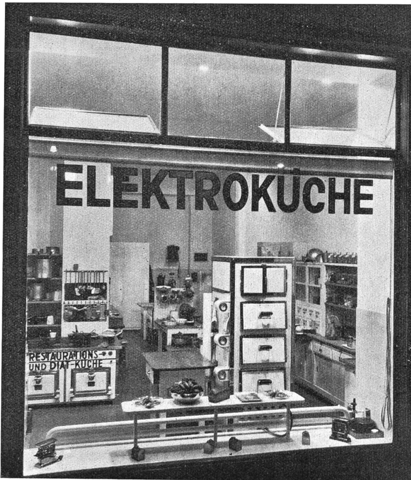
Abb. 4 Blick in die Küche des Restaurant «Katz». Nebenstehendes Bild zeigt die Küche von der Strasse her, also so, wie sie die Passanten sehen. Man sieht, dass die Küche vollständig überblickt werden kann, dass also darin gewissermassen im «Glas-kasten» gearbeitet werden muss. Das Bild ist eine Nachtaufnahme, bei künstlicher Beleuchtung durch das Schaufenster hindurch gemacht. Die fast vollständige Schattenlosigkeit des Raumes zeigt, wie sorgfältig und vorzüglich auch in der Küche die Frage der künstlichen Beleuchtung gelöst worden ist.