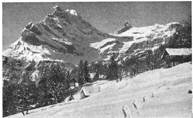
Abb. 25 Braunwald; rechts das elektrifizierte Chalet.

temperatur, die im Winter häufig — 20 Grad Celsius erreicht, mit 1,2 oder 6 kW Strom zuzuführen. Ausserdem ist für die Uebergangsheizung eine Steckdose vorhanden, um einen der verschiedenen Zimmeröfen, die von 1—2 kW regulierbar sind, anzuschliessen. Die Wohndiele wird ebenfalls auf