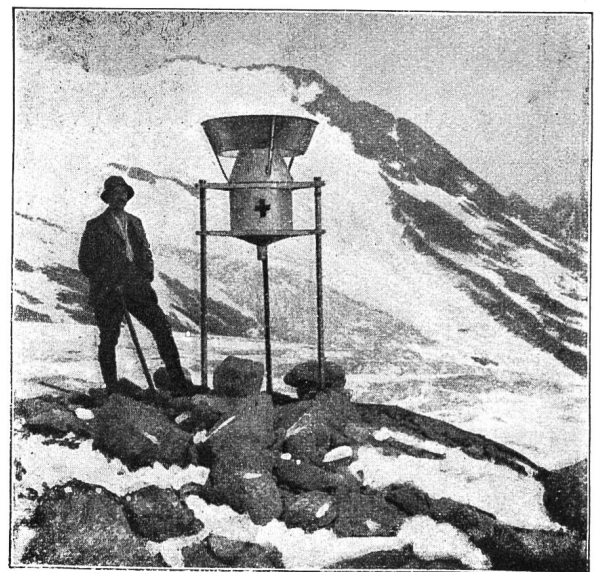
Abb. 2. Totalisator am Konkordiaplatz (2850 m) erstellt von der Schweiz. Landeshydrographie.

Die respektable Zahl unserer Niederschlagssammler im Gebirge verteilt sich hauptsächlich auf folgende Zonen: im Aletschgletscher- und Jungfraugebiet (Höhen bis zu nahe 4000 m); im Mattmark- und Zermatter Bezirk (Höhen um 2200 m bis 3600 m); im Gotthardrevier (an der Fibbia bis zu 2850 m), dann weiter am unteren und oberen Rhonegletscher (bis nahe an 3000 m); im Gebiet des Grimselpasses und seiner näheren stark vergletscherten Umgebung (bis 3300 m); an den Diablerets- und Ornyglet-