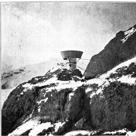
Abb. 1. Niederschlagssammler am obern Rhonegletscher (2860 m) erstellt von der Schweiz. Meteorol. Zentralanstalt. (Derselbe Typ am Jungfraujoeh)

Seit zwei Dezennien bestehen unsere Niederschlagssammler im Hochgebirge, die im Laufe des Jahres ein- bis zweimal kontrolliert und entleert werden. Wir dürfen wohl mit Recht behaupten, daß durch ihre Aufstellung nach und nach die bisherige Dürftigkeit unseres Wissens über die Niederschlagshöhen der eigentlichen Hochregion nicht mehr besteht. Allerdings ist hier noch vieles zu tun, denn wir sind noch lange nicht am Ende, und den Schwierigkeiten wird nur nach und nach beizukommen sein. Seit dem Jahre 1913 sind bereits über 100 Apparate in der Zone unseres Hochgebirges installiert worden, die als sogenannte „Totalisatoren“ mit Windschutzschirm versehen, zu meist brauchbare und nützliche Resultate für