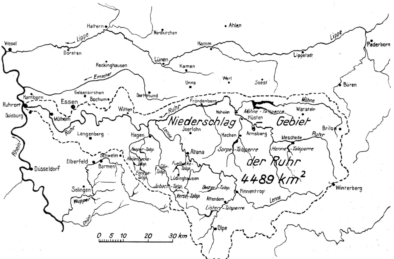
Abb. 1. Lageplan des Ruhrgebietes.