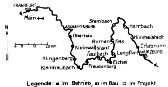
Abb. 3 Uebersichtsplan der Mainkanalisierung Aschaffenburg-Würzburg

Der Main soll durch diese Arbeiten zur Grossschiffahrtsstrasse für den 1500-Tonnen-Schleppkahn ausgebildet werden. Der Schiffsahrtsweg wird dabei ohne Ausnahme im alten Flussbett belassen, dessen Minimalkrümmung mit einigen