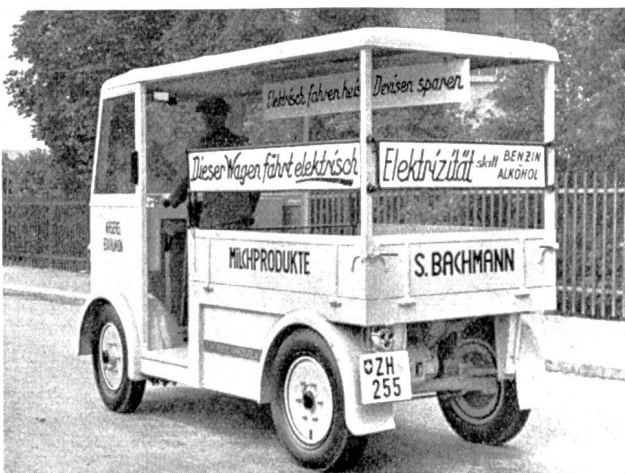
Fig. 47 Dieses Fahrzeug, ein Milchwagen in Eschlikon, Kt. Thurgau, mit einer Nutzlast von 1000 kg besitzt eine Geschwindigkeit von 20 km/h und einen Aktionsradius von 50—60 km pro Batterieladung. Der Wagen ist ausgerüstet mit einer Panzerplatten-Batterie, für die eine Garantie von 3 Jahren eingeräumt wird, in dem Sinne, dass die Kapazität nach Ablauf dieser Zeit noch mindestens 80% beträgt. Durch die Pneuberufung erhält der Wagen eine tadellose Abfederung, was auf die Lebensdauer der Batterie sich sehr günstig auswirkt. Der Erfolg, der am Tage der Stilllegung der übrigen Kraftfahrzeuge erzielt wurde, darf als ganzer gebucht werden, denn überall wurde dem Fahrzeug die grösste Aufmerksamkeit geschenkt. Die Lieferfirma, Elektrische Fahrzeuge A.-G., Zürich-Oerlikon, konnte inzwischen verschiedene Anfragen entgegennehmen, die auf diesen Propaganda-Feldzug zurückzuführen sind.