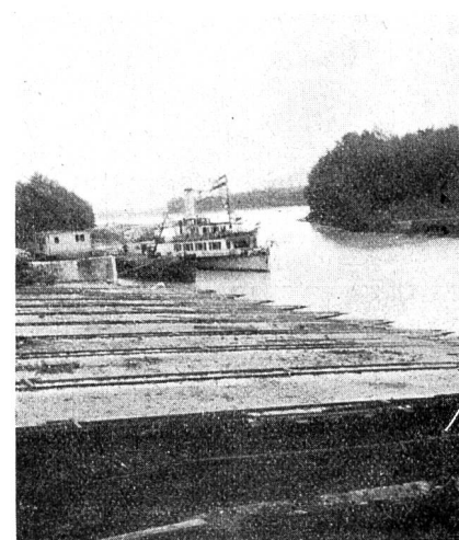
Abb. 8 Schiffswerft Kornenburg. Einfahrt ins Hafenbecken, im Hintergrund die Donau.

Eine in das Schiff eingebaute Lautsprecheranlage ermöglichte die Uebertragung der Vorträge in alle Räume des Dampfers. Gruppenweise wurden hierauf die Teilnehmer durch die verschiedenen Abteilungen der Werft geführt. Besonderes Interesse erregte hierbei ein neuer, mechanischer Schiffsaufzug, mit dem die Dampfer nicht wie üblich senkrecht zur Uferlinie, sondern parallel zu dieser aufs Trockene gehoben bzw. zu Wasser gelassen werden (Abb. 7 und 8).