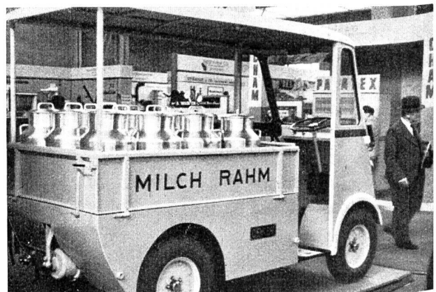
Fig. 22 Milch-Lieferungswagen der Eisen- und Stahlwerke Oehler & Co. A.G., Aarau. Véhicule électrique pour le transport du lait, construit par les Usines métallurgiques Oehler & Co., S.A., Aarau.

Die diesjährige Messe hat für die elektrotechnische Branche wieder zahlreiche Vervollkommnungen und Verbesserungen gebracht, alle in unermüdlicher Kleinarbeit geschaffen und auf die Betriebspraxis abgestellt. Wer auf Einzelheiten eintritt, kann die immer wieder zu vernehmende Meinung nicht teilen, dass die Messe jedes Jahr das Gleiche bringe. Freilich wird es den Interessenten oft recht schwer gemacht, das typisch Neue zu erkennen. Es dürfte sich empfehlen, im Prospektmaterial betonter auf das Neue hinzuweisen. Der Interessent ist enttäuscht, wenn ihm ein Prospekt in die Hand gedrückt wird und er nach einigen Minuten Lesens merkt, dass es sich dabei um eine seit Jahren bekannte Einrichtung handelt. Ein solches Vorgehen hat meistens negative Werbewirkung. Wir möchten auch anregen, jene Einzelheiten, deren Zweck oder Bau äusserlich nicht ohne weiteres ersichtlich ist, durch passende Beschriftung leichter verständlich zu machen Bü.