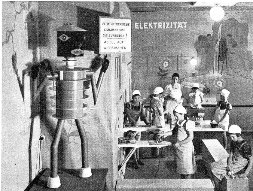
Fig. 44 Teilansicht der Elektrizitätsausstellung: Kinderküche und «Elektrogeist». Vue partielle de l'Exposition d'électricité: Cuisine pour enfants et «Fantôme-électrique».

seien noch Modelle erwähnt, die in treffender Weise die Vorteile richtiger Beleuchtung von Wohn- und Arbeitsstätten zum Ausdruck brachten, sowie eine hübsche Zusammenstellung über die Entwicklung der Installations- und Lichttechnik.