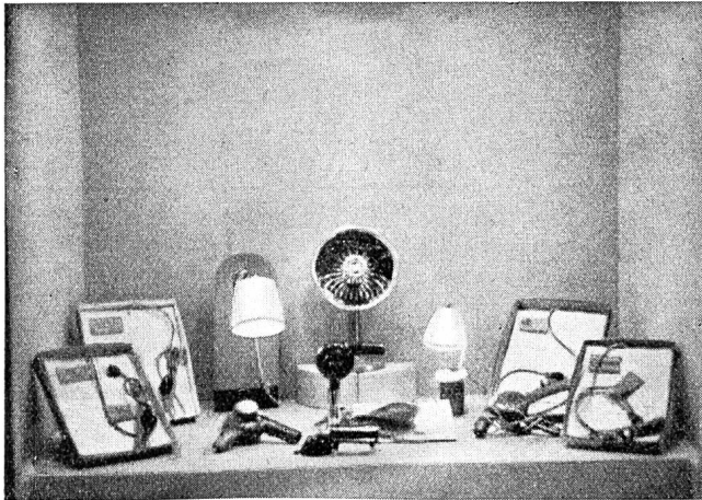
Fig. 30 Schaufenster des Elektrizitätswerkes der Stadt Zürich. Vitrine du Service de l'Electricité de la Ville de Zurich.

Nachstehend zeigen wir sechs weitere Ansichten von Schaufenster-Ausstattungen. Die sich bisher noch nicht beteiligten Werke sind wiederholt zur Mitarbeit freundlich eingeladen.