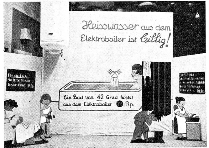
Fig. 34 Schaufenster der Aare-Tessin A.G. für Elektrizität, Olten. Vitrine de l'Aar et Tessin S.A. d'Electricité, Olten.