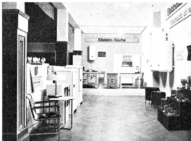
Fig. 36 Stand der Aare-Tessin A. G. für Elektrizität, Olten, an der Wanderausstellung «Gut Haushalten» in Olten.

Abbildung 36 zeigt den Stand der Aare-Tessin A. G. für Elektrizität an der Ausstellung im Hotel Schweizerhof in Olten, die im Monat Mai in Olten stattgefunden hat. Es wurde damit gezeigt, wie vielseitig und vorteilhaft die Elektrizität im Haushalt Verwendung finden kann. Den Kernpunkt des Standes bildete die Elektro-Küche, in der von der Haushaltlehrerin der «Atel» auf verschiedenen Herdmodellen gekocht und gebacken wurde. Instruktive Beschriftung gaben Auskunft über die Betriebskosten des elektrischen Kochens für verschiedene Verhältnisse. Mit einem 50-l-Boiler wurde veranschaulicht, wie einfach und billig das für die Küche benötigte Heisswasser bereitet werden kann. Im Küchenbuffet war ein elektrischer Kühlschrank eingebaut und auf dem Arbeitstisch wurde eine elektrische Universal-Küchenmaschine praktisch vorgeführt. Des weitern wurde gezeigt, welche Annehmlichkeiten Wärmepatte, Brezelleisen und sog. Schnellkocher für den Haushalt darstellen und wie diese Apparate vorteilhaft verwendet werden.