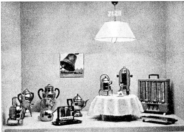
Fig. 31 Schaufenster des Elektrizitätswerkes der Stadt Zürich. Vitrine du Service de l'Electricité de la Ville de Zurich.