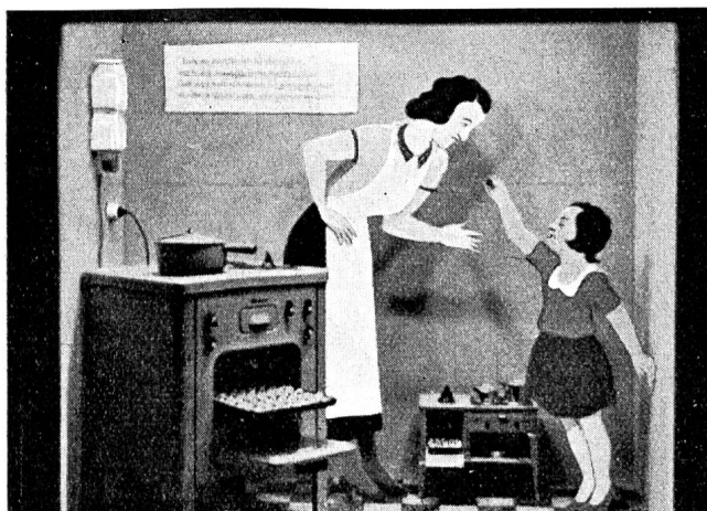
Fig. 32 Schaufenster des Elektrizitätswerkes der Stadt Zürich. Vitrine du Service de l'Electricité de la Ville de Zurich.