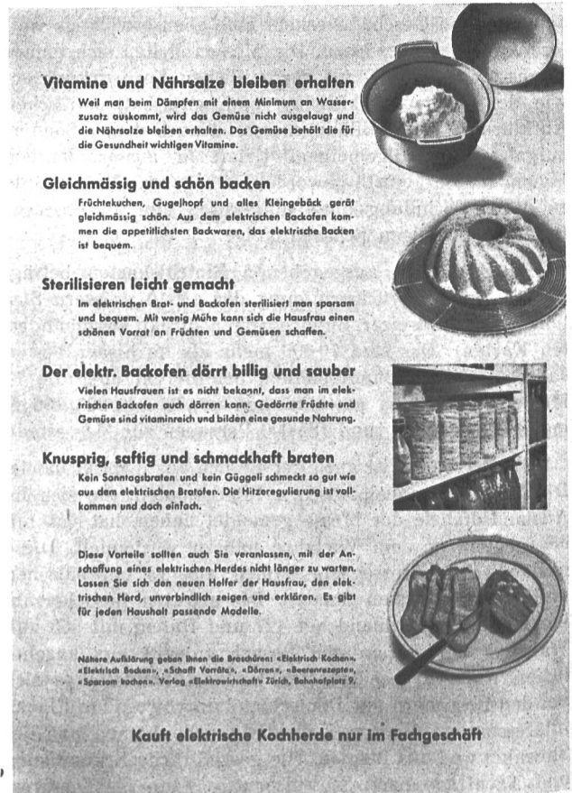
Fig. 32 Es fehlte bisher an einem einfachen Flugblatt, das in konzentrierter Zusammenstellung die Vorteile der elektrischen Küche darlegte. Auf vielseitigen Wunsch hat die «Elektrowirtschaft» nun oben wiedergegebenes Flugblatt (Format 210x297 mm) geschaffen, das sich gut zur Massenverteilung eignet. Preisangebote durch die «Elektrowirtschaft», Bahnhofplatz 9, Zürich 1. — Dieses Flugblatt erscheint demnächst auch in französischer Sprache.