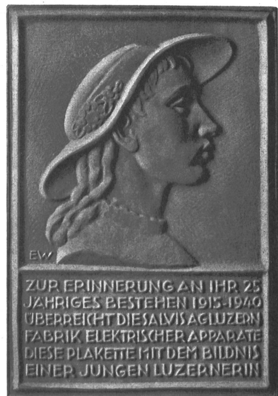
Fig. 31 Wiedergabe der durch die Salvis A.G., Luzern, anlässlich ihres 25jährigen Bestehens herausgegebene künstlerische Erinnerungplakette, die in einem Salvis-Keramikofen hergestellt wurde.

Die interessanten und zeitgemässen Vorträge werden demnächst in einem Sonderheft der internationalen Zeitschrift «Elektrizitäts-Verwertung», die von der «Elektrowirtschaft» herausgegeben wird, erscheinen.