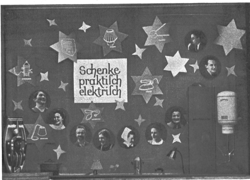
Fig. 35 Das Weihnachtsschaufenster stand unter dem Motto «Schenke praktisch, elektrisch».