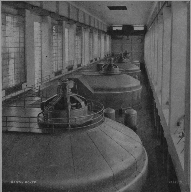
4 Dreiphasen-Generatoren des Rheinkraftwerkes Ryburg-Schwörstadt

Technische Bureaux in Baden, Basel, Bern und Lausanne