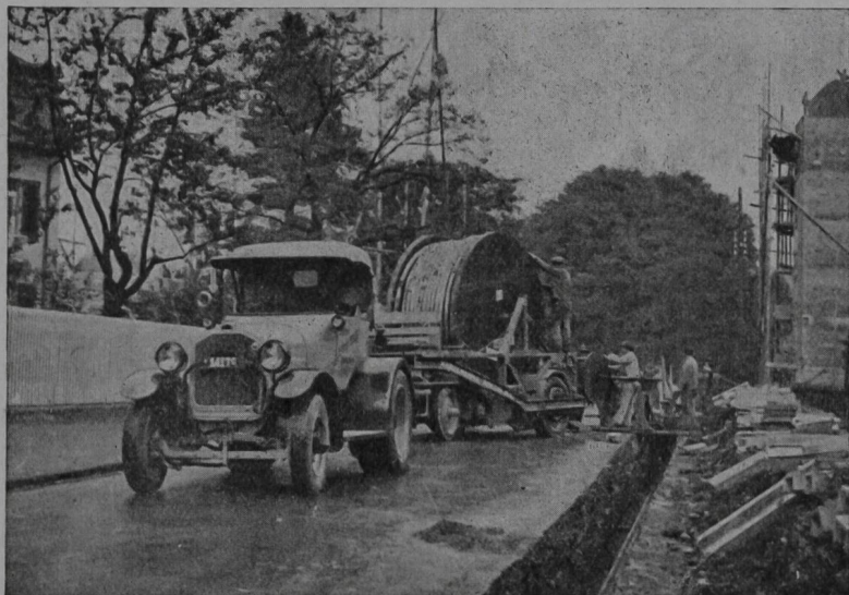
Verlegung von 6-kV-Kabeln 3 \times 240 \text{ mm}^2 für das Elektrizitätswerk der Stadt Bern.