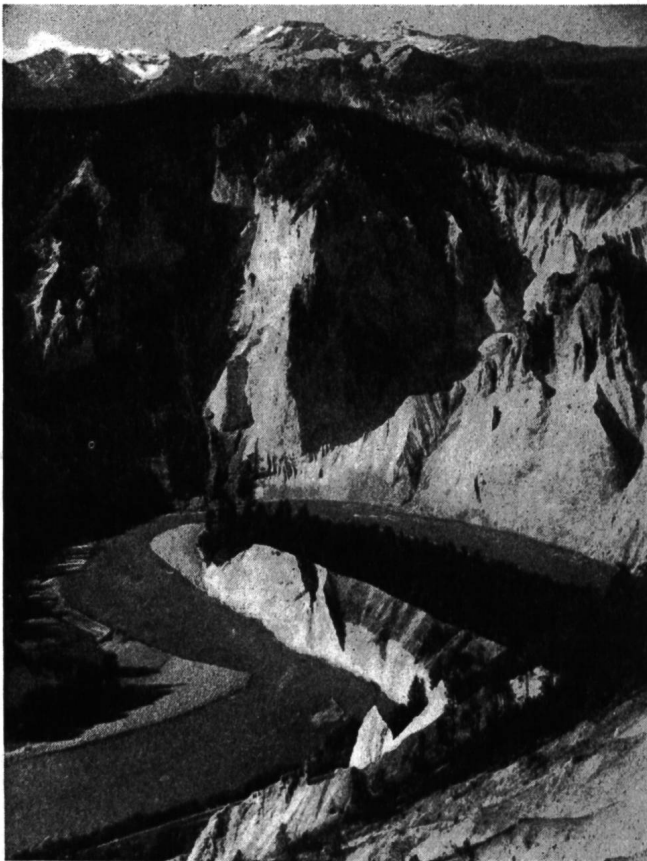
Abb. 6 Der im Flimser Bergsturz tief eingeschnittene Vorderrhein kurz vor der Vereinigung mit dem Hinterrhein.

Für die Wasserkraftanlagen am Rhein unterhalb des Bodensees, aber auch für die Schifffahrt ist die Schaffung