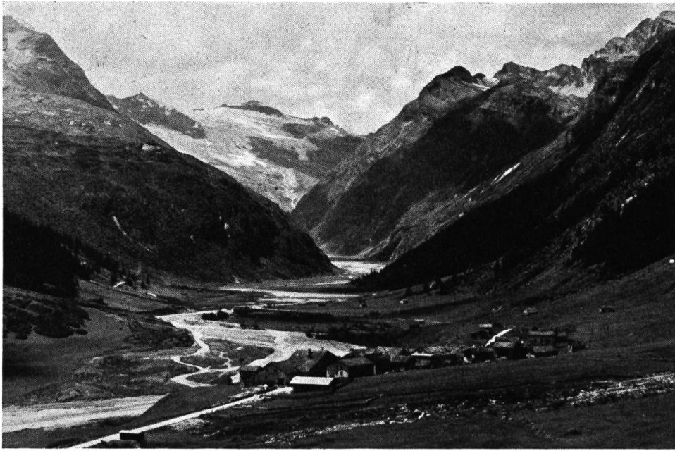
Abb. 1 Die Quellen des Hinterrheins im Zapport.