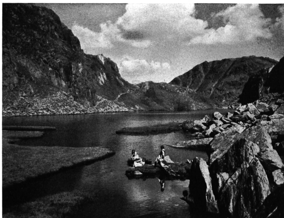
Abb. 4 Der Tomasee im Quellgebiet des Vorderrheins.

Im Gebiete des Vorderrheins und seiner Zuflüsse bestehen als größte Anlagen die drei der Patvag gehörenden Kraftwerke Russein, Pintrun und Tavanasa, die ihre Energie der Holzverzuckerungsfabrik in Domat/Ems abgeben; die Kraftwerkgruppe Zervreila-Rabiusa wurde bereits erwähnt. Schon vor Jahren bewarben sich die Central-schweizerischen Kraftwerke Luzern um Wasserrechtsverleihungen im Tavetsch und im Medelsertal für Überleitung gewisser Wassermengen ins Flußgebiet der Reuß. Es ist ferner bekannt, daß die Nordostschweizerischen Kraftwerke sich schon seit einiger Zeit mit der Frage einer Nutzung der Wasserkräfte am Vorderrhein und seinen Zuflüssen von den Quellen des Rheins bis Reichenau, als rein bündnerische Lösung, ohne Wasserableitungen, beschäftigen. Nach den bisherigen Untersuchungen kann in diesem großen Flußgebiet mit der Schaffung verschiedener Speicherseen eine Wasserkraft-