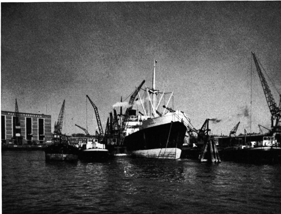
Hafen von Rotterdam, Umlad von einem Hochseedampfer auf einen Rheinkahn (Photo Tom Kroeze, Rotterdam).

Die Schweiz kann keine Hand bieten zu Lösungen,