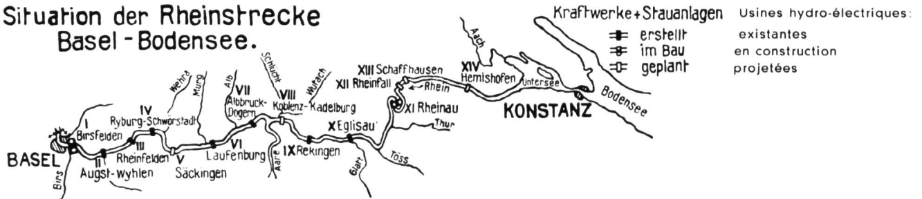
Aménagement du Rhin entre Bâle et le lac de Constance