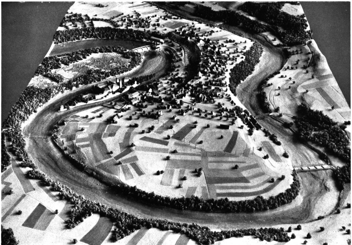
Modell der Kraftwerkanlagen Rheinau. Links oben: Stauwehr und Maschinenhaus (linkes Ufer). Rechts oben und unten: Unteres und oberes Hilfswehr. Rechts Mitte: Gedeckte Brücke.

Rheinau darf nicht dem Fanatismus unverantwortlicher Kreise geopfert werden. Die Schweiz würde sich auf der ganzen Welt lächerlich machen, wollte sie ein halbfertiges, notwendiges Kraftwerk heute wieder abbrechen. Die Rheinau-Initiative verdient mit großer Wucht abgelehnt zu werden.