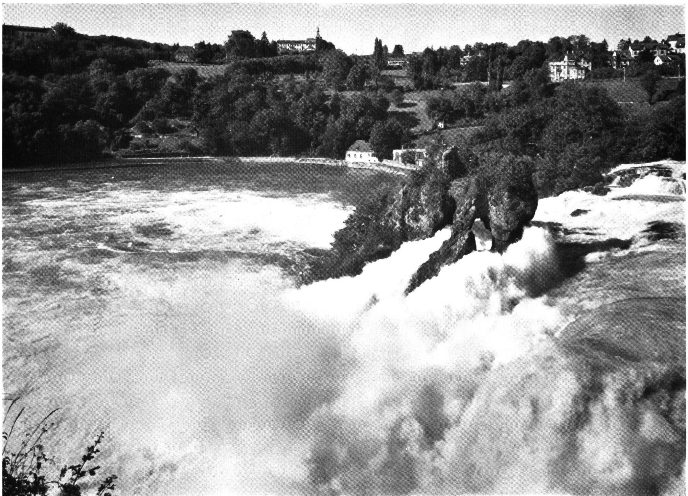
Der Rheinfall, so ist er, so bleibt er! La chute du Rhin, telle qu'elle est et telle qu'elle restera!

Nous allons rapidement évoquer les divers aspects de ce qu'il est convenu d'appeler l'affaire de Rheinau.