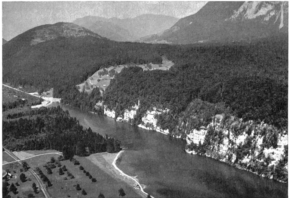
Abb. 1 Stauwehr und Stausee des Kraftwerkes Sarneraai

mit oberer Wasserkammer ist 70 m vor der Zentrale im Berginnern angeordnet. Da der Druckstollen durchwegs im guten Fels zu liegen kam, genügte eine Betonverkleidung der Sohle und des unteren Teils der Seitenwände, während die restliche Stollenfläche nur gunitiert wurde.