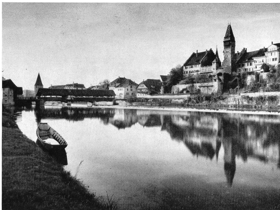
Bremgarten am Unterlauf der Reuß

Das Projekt wird ähnlich wie dasjenige von 1941/45 die Korrektur der Seitenbäche mit Geschiebesammeln, die Erweiterung der bestehenden Kanäle, die Intensivierung der Entwässerung durch neue Kanäle und den Schutz der Ebene vor den Reußhochwassern durch genügend hohe und standfeste Hochwasserdämme ent-