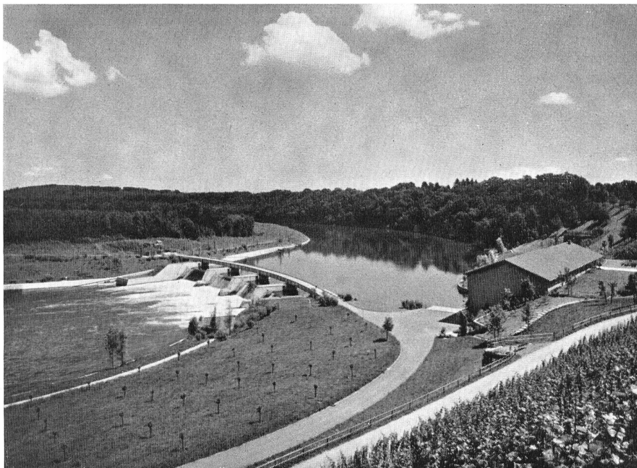
Bild 1 Hauptstauwehr und Zentrale Rheinau