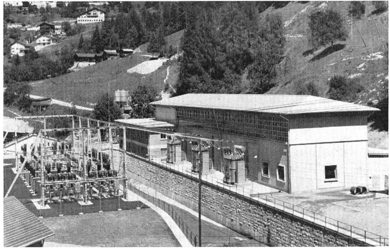
Bild 3 Zentrale Vissoie im Val d'Anniviers, inst. Leistung 45 MW, der mittleren Gefällsstufe Lac de Moiry—Vissoie. Zwischen dem Maschinenhaus und der im Bilde links sichtbaren Freiluftschaltanlage befindet sich das Flußbett der Navisence. Links oben ist ein Teil des Dorfes Vissoie sichtbar; einige Neubauten wurden durch den Kraftwerkbau veranlaßt, nämlich zwei Personelhäuser und das mit finanzieller Unterstützung der Kraftwerkgesellschaft erstellte Krankenhaus der Talschaft.

Jedem Gast wurde ein Exemplar der gediegenen