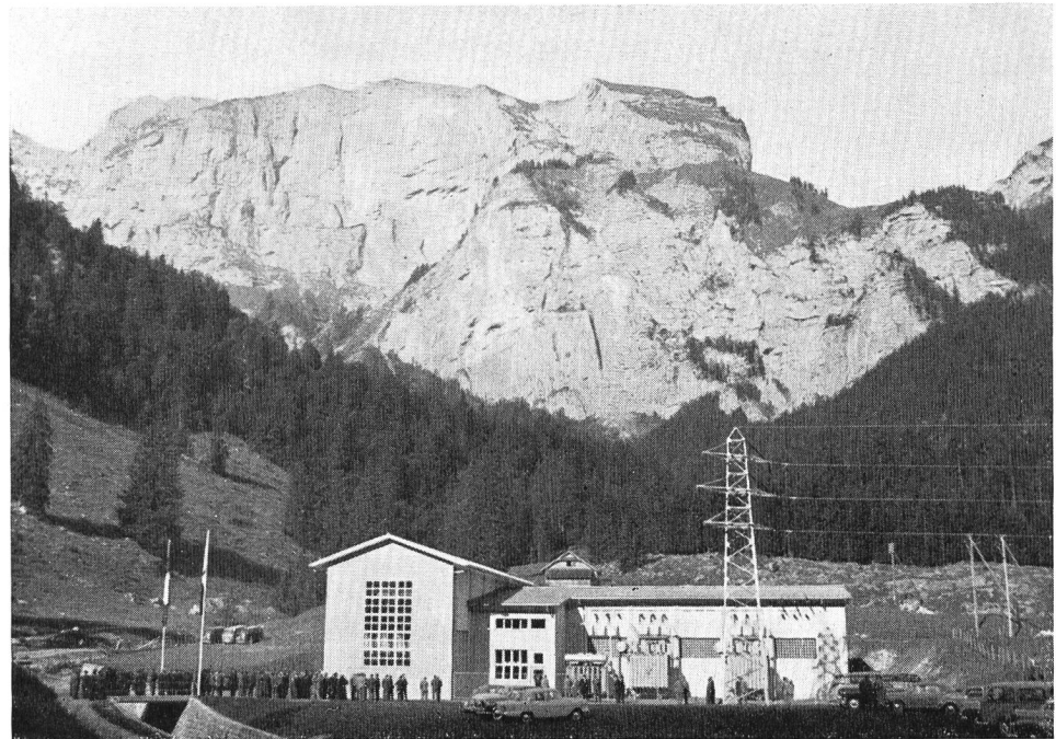
Bild 2 Zentrale Hugschwendi in der Stöckalp; Einweihungsfeier des Kraftwerks Melchsee-Fruttl

einzelnen Gänge vom Strom der vielen Tischreden unterbrochen wurden! Von verschiedenen Rednern wurden besonders die Verdienste von Ing. Stadelmann , Bern, Sektionschef im Eidg. Amt für Wasserwirtschaft, gewürdigt.