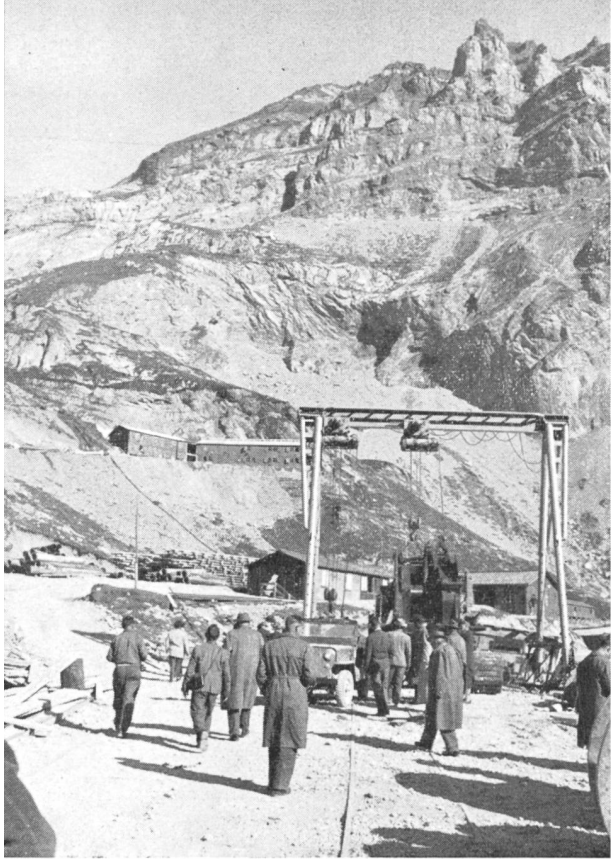
Bild 2 Großbaustelle Limmernboden im Aufbau