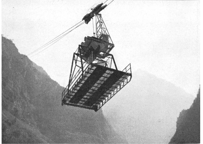
Bild 4 Mit der außerordentlich kühnen Schwereiseilbahn für 18-t-Lasten wird die große Höhendifferenz in kürzester Zeit überwunden