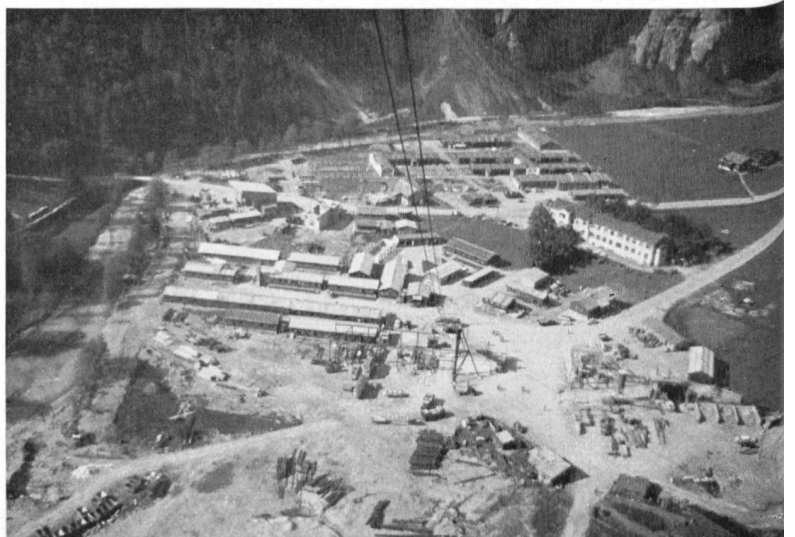
Bild 6 Tiefblick aus der Schwereiseilbahn auf die ausgedehnten Installationen im Tierfehd