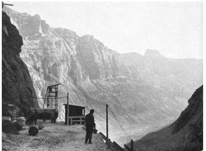
Bild 5 Am rechten Widerlager für die große Bogenstaumauer; Blick auf den Limmernboden