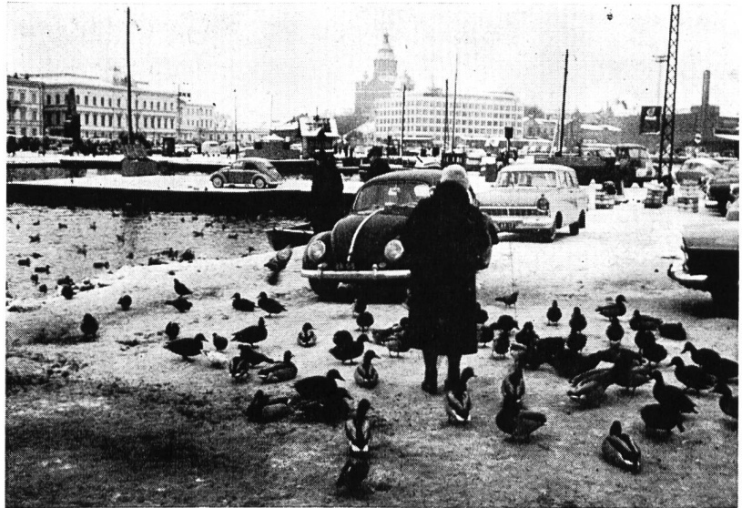
Bild 5 Motiv aus dem winterlichen Helsinki

Nach diesen erlebnisreichen Tagen mit so viel herzlicher Gastfreundschaft befreundeter Verbände und lieber langjähriger Bekannten trat ich am 5. Dezember 1961 den Rückflug nach der Schweiz an mit zwei längeren Flughalten im großartigen neuen Flughafen von Kopenhagen und in Düsseldorf; die totale Nettoflugzeit mit «Metropolitan» (Helsinki—Kopenhagen) und «Caravelle» (Kopenhagen—Düsseldorf—Zürich) betrug nur 5 Stunden 22 Minuten für die etwa 2200 km messende Flugstrecke. Der Flug bei starkem Wind, stets an der oberen Grenze der Wolkendecke, von Helsinki