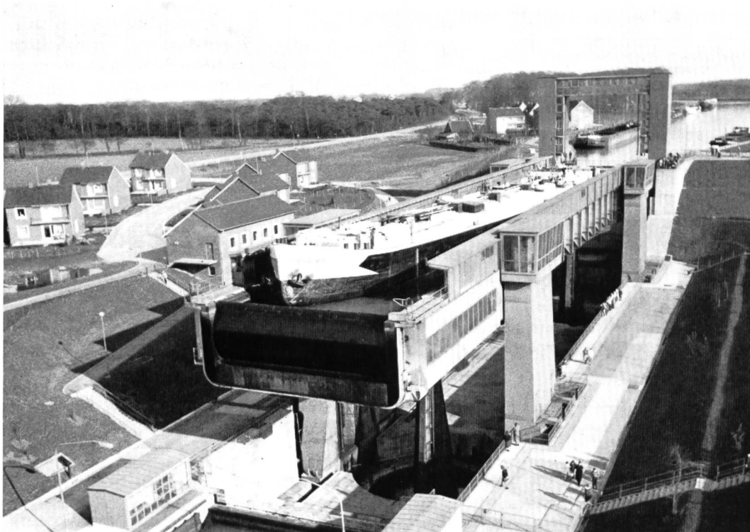
Bild 3 Schiffshebewerk Henrichenburg in Waltrop am Dortmund-Ems-Kanal

Zur Entlastung des Rhein-Herne-Kanals, der nach dem Rhein und dem Dortmund-Ems-Kanal die verkehrsreichste