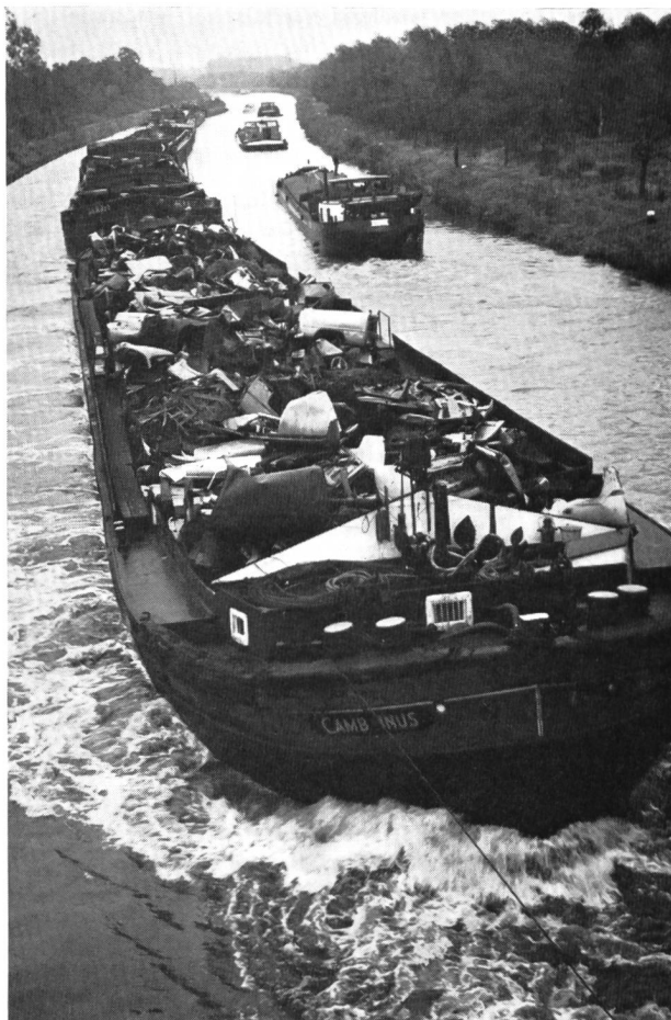
Bild 2 Verkehr auf dem Mittelland-Kanal

Der ostwärts gerichtete Kanalverkehr — gemeint ist hier der Wechselverkehr zwischen dem Rhein-Ruhr-Gebiet und den deutschen Seehäfen einerseits und dem mitteldeutschen Wirtschaftsraum andererseits — wird auf dem südlichen Dortmund-Ems-Kanal bei der Schleuse Münster statistisch erfasst. Hier stellen wir die folgenden Leistungsziffern fest: