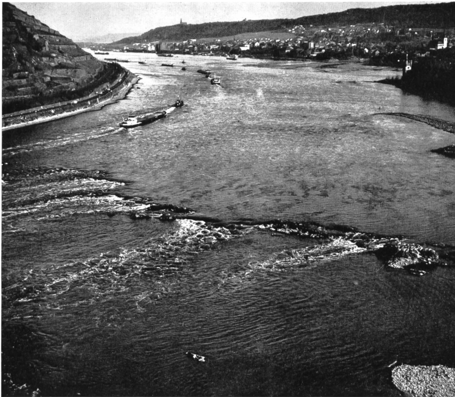
Bild 8 Die Felsenbänke am Binger Loch

über die Anwendung des EWG-Vertrages auf die Rheinschifffahrt hat die EWG-Kommission zwar den Standpunkt vertreten, dass die von ihr beabsichtigten Massnahmen auf dem Verkehrssektor weder die Freiheit der Schifffahrt noch die Freiheit des Handels beeinträchtigen, jedoch ist diese Auffassung mehr als umstritten. Ein besonderes Problem stellt hierbei die Stellung der Schweiz dar, die zwar Mitglied der Zentralkommission für die Rheinschifffahrt, der Hüterin der Mannheimer Akte, jedoch nicht der Europäischen Wirtschaftsgemeinschaft ist.