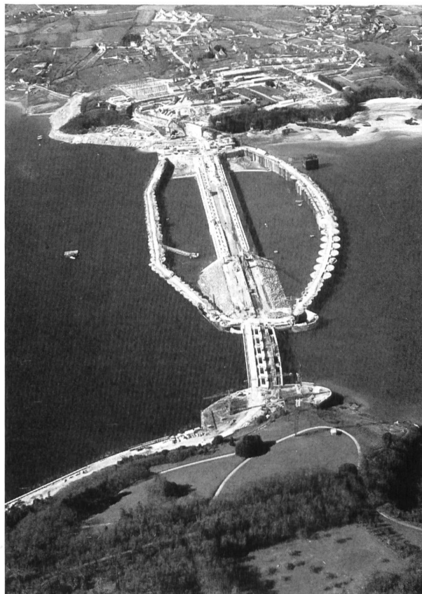
Gesamtübersicht des Gezeitenkraftwerks «La Rance». Im Vordergrund des Bildes das Wehr mit seinen sechs Oeffnungen; in der Bildmitte — in der gefluteten Baugrubenumschliessung — der Damm mit dem angebauten Maschinenhaus, in dem auch der Kommandoraum untergebracht ist; im Hintergrund die Schiffsschleuse, Strassenzufahrt und 225 kV Umspannstation.

beckens Energie erzeugt, und zwar mit umgekehrter Strömungsrichtung in den Turbinen. Eine Möglichkeit, die potentielle Gezeitenenergie noch besser auszunutzen besteht darin, dass der Niveauunterschied während der Uebergangszeiten durch Hochpumpen von Wasser erhöht und damit ausserdem die Nutzwassermenge vergrössert wird. Im Gezeitenkraftwerk an der Rance finden diese drei Methoden Anwendung.