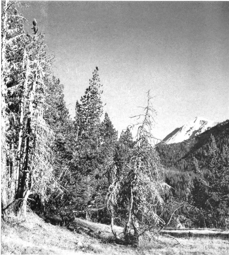
Bild 121 Bergföhrendickicht bei Stavelchod im Val dal Fuorn