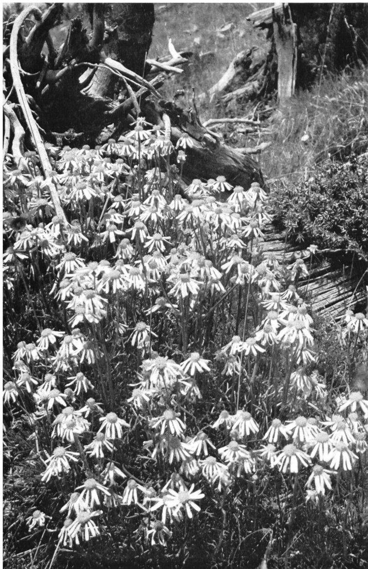
Bild 119 Orangefarbenes Kreuzkraut ( Senecio abrotanifolius ) im Nationalpark (Charakterpflanze!)

Man spricht vom «Stolz» des Tals am obersten Inn und vom «Stolz» seiner Menschen — und gibt sich einer Täuschung hin. Vielleicht muss man wie der Berichterstatter durch ein halbes Jahrhundert die Höhen überklettern, die rauhen Nebentäler durchwandern, Zugang bis in die Cuort und die Chamineda, Zugang zu den Herzen gefunden haben, um die eigentliche Wesensart richtig zu deuten: Bestimmend für den Charakter des echten Engadiners ist das Bewusstsein einer naturgegebenen und durch Jahrhunderte gewordenen Eigenart seines Tals. Es ist eine in sich geschlossene kleine Welt. Und zugleich ist das Engadin jahrhundert-, nein, jahrtausendaltes Pass- und Durchgangsland und deshalb offen gegen Ost und West, nach Norden und erst recht nach Süden.