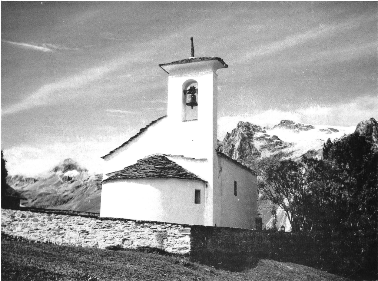
Bild 123 Das idyllische Kirchlein von Fex, das noch auf romanische Zeit zurückreicht, geht der baldigen Sicherung entgegen

kaum 570 mm jährlichem Niederschlag gehört dieser Teil Graubündens zu den regenärmsten Landstrichen der Schweiz. Der starkduftende Sevistrauch ( Juniperus Sabina ) kriecht über die Felsen, Federgräser ( Stipa capillata und pennata ) wehen im heissen Sommerwind; der dem Goldregen verwandte Cytisus radiatus , ein Kleinod der Unterengadiner Flora, bietet seine unzähligen sattgelben Schmetterlingsblüten der Sonne dar. Und wenn sich dann der Pflanzenkenner durch die noch im Zerfall so stolze Burg ruine Tschanüff in die Nähe locken lässt, so wird er seltenen Arten begegnen, die in Graubünden keinen andern Standort haben.