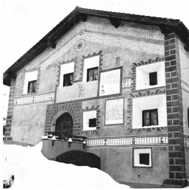
Bild 129 Das Haus Stupan an der Hauptgasse in Ardez ist heute eine Zierde der Gemeinde geworden (1966).