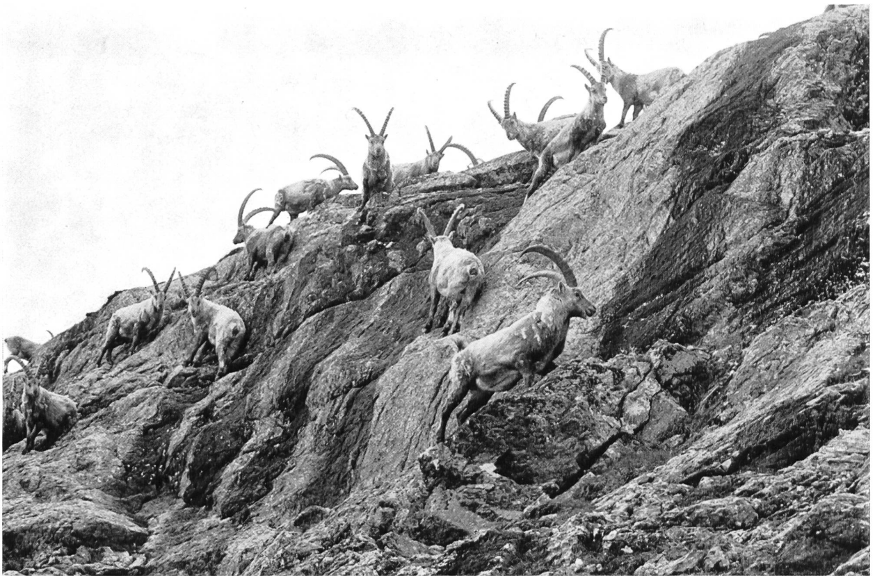
Bild 136 Die eher plumpen, gravitatisch kletternden Steinböcke in den Felsen des Piz Albris