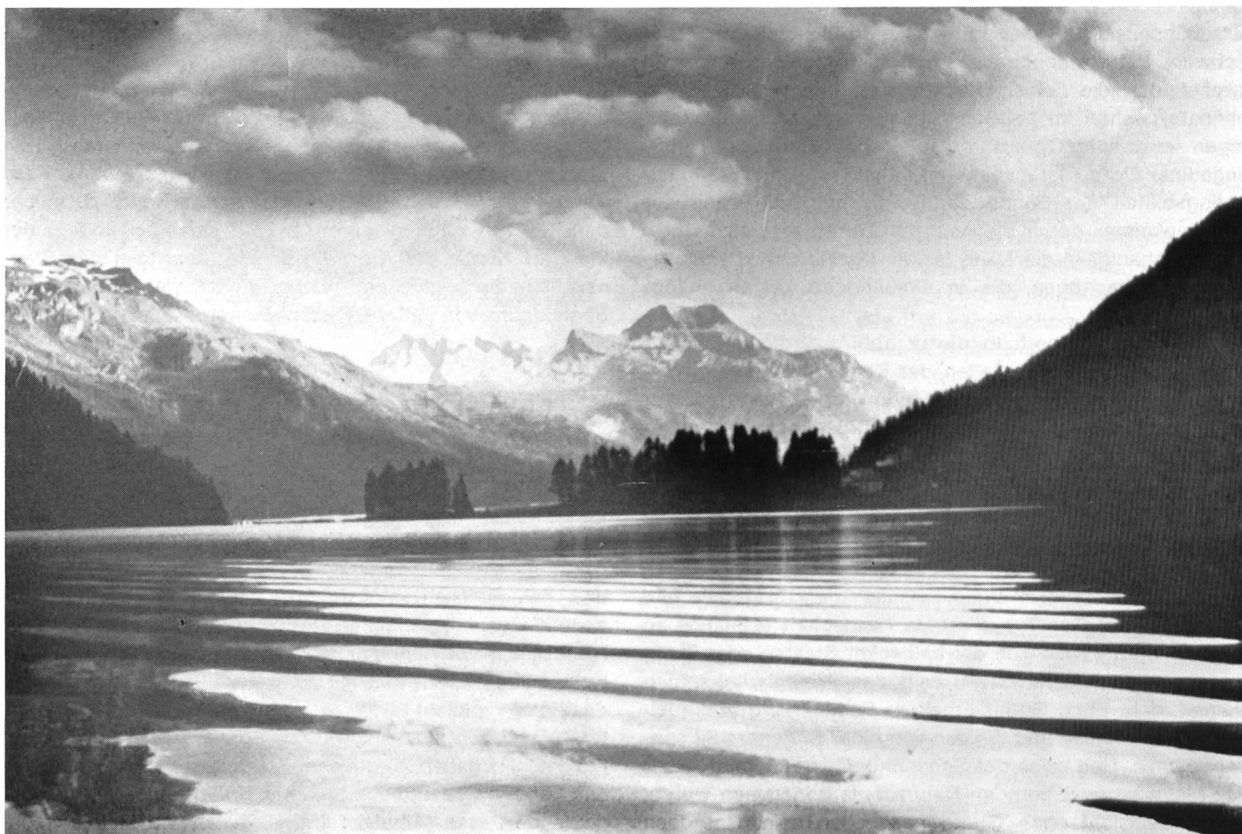
Bild 124 Abendstimmung an den Oberengadiner Seen bei Silvaplana

Vor wenigen Jahren noch war die nach der Reformation profanierte Kapelle gleichen Namens in Zuoz — Fasslager einer Weinhandlung, wiewohl der ungeschlachte Moränenblock an ihrem Eingang vielleicht heidnischer Opferstein war und sich in ihrem Innern fünfhundertjährige Fresken eines unbekanntenen Meisters aus dem deutschen Kunstkreis finden. Das leuchtendtiefe Krapprot in den Mänteln der Heiligen, die zart blaugrünen Töne in den Ueberwürfen der Gottesmutter und des Verkündigungse Engels sind uns kaum sonstwo in gleicher Strahlungskraft begegnet. Es war Gefahr, dass diese kunstgeschichtliche Kostbarkeit dem Zahn der Zeit zum Opfer fiel — in letzter Stunde hat sich unter den Dorfgenossen eine Vereinigung «Pro San Bastiaun» gebildet, die mit den zuständigen amtlichen Instanzen bereits die ersten Forschungsarbeiten abgeschlossen hat. Wir denken schliesslich auch an die evangelische Pfarrkirche von Sent, deren neugotische Turmkonstruktion kaum ahnen lässt, was für ein intimer Gottesdienstraum sich vor uns öffnet. Seit der Restaurierung im Sinn wachen Heimatschutzes, die den originellen Taufstein aus dem Erdgeschoss des Turmes zurückversetzte in den Chor, die reizvolle Kanzel aus dem Jahre 1712 mit ihrer originellen Flachschnitt-Ornamentik und das reiche Wandtabernakel