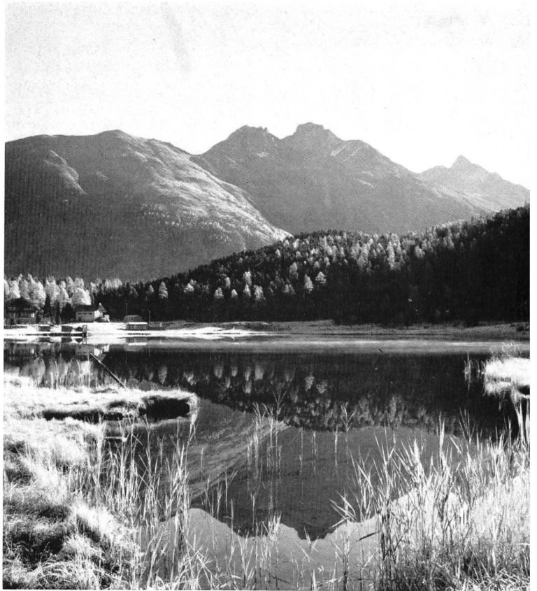
Bild 125 Der stille Stazersee im Blick gegen Schafberg, Zwei Schwestern, Piz Muragl und Piz Languard an einem Novembertag

Man würde sich indessen einer groben Täuschung hingeben, wollte man meinen, die genannten aus idealen Motiven wirkenden Vereinigungen oder die Behörden des so erfreulich aufgeschlossenen Kantons Graubünden oder der Gemeinden würden die oft sehr beträchtlichen Kosten fälliger Restaurierungen übernehmen — davon kann schon angesichts der beschränkten Mittel keine Rede sein. Stets hat der Eigentümer die Hauptlast zu tragen; von anderer Seite, auch vom Heimatschutz, fliessen ihm lediglich — oft nur als «Anerkennung» — Teilbeträge zu. Um so anerkannter ist die Tatsache, dass in den letzten Jahren eine eigentliche «Renaissance» durch die Dörfer schwingt: Verblichene, mehrfach übertünchte und gar zerbröckelnde Sgraffitofronten leuchten in neugewonnener Schönheit und prägen damit das gesamte Strassenbild. Drei Dinge wirken hier als treibende Kräfte: zum ersten das lebendige Bewusstsein der Engadiner Eigenart; zum zweiten die Tat-