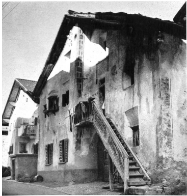
Bild 130 Haus Vulpius in Ftan im alten, gefährdeten Zustand (1965).