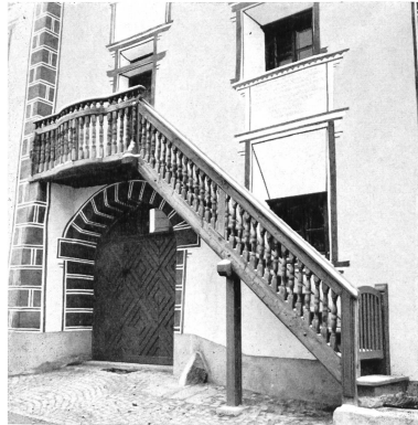
Bild 131 Ftan. Die einzigartige Aussentreppe zum einstigen Wohnhaus des Bibelübersetzers Pfr. Vulpius nach der Erneuerung.