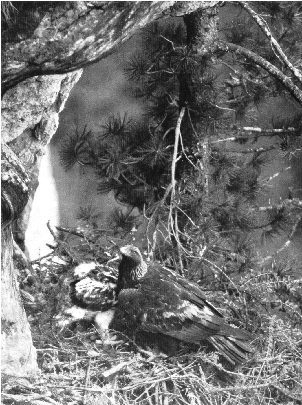
Bild 120 Steinadler, der Stolz der Bergheimat, im Felsenhorst ( Aquila chrysaetos )

jeder Naturfreund zur Kenntnis, was der Verwalter des «Parc nazional» Dr. F. R. Schloeth, in Heft 3/1966 der Zeitschrift «Schweizer Naturschutz» schrieb: «Empfindliche Störungen des Wildes durch den Baulärm und die Betriebsamkeit der vielen Arbeiter haben sich nicht eingestellt. Es ist ja erstaunlich, wie rasch sich die Tiere an regelmässig auftretenden, gewissermassen vertrauten Lärm gewöhnen. Die Befürchtung einiger Naturfreunde, das Wild werde der erste Leidtragende der Bauarbeiten sein, hat sich bis jetzt nicht bestätigt.»