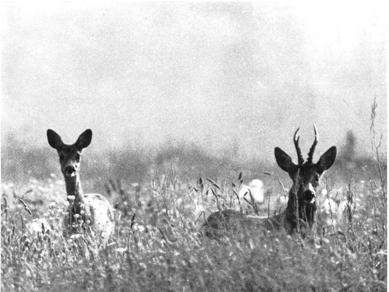
Bild 137 Zierliches Reh-Paar im duftigen Frühlingsgras