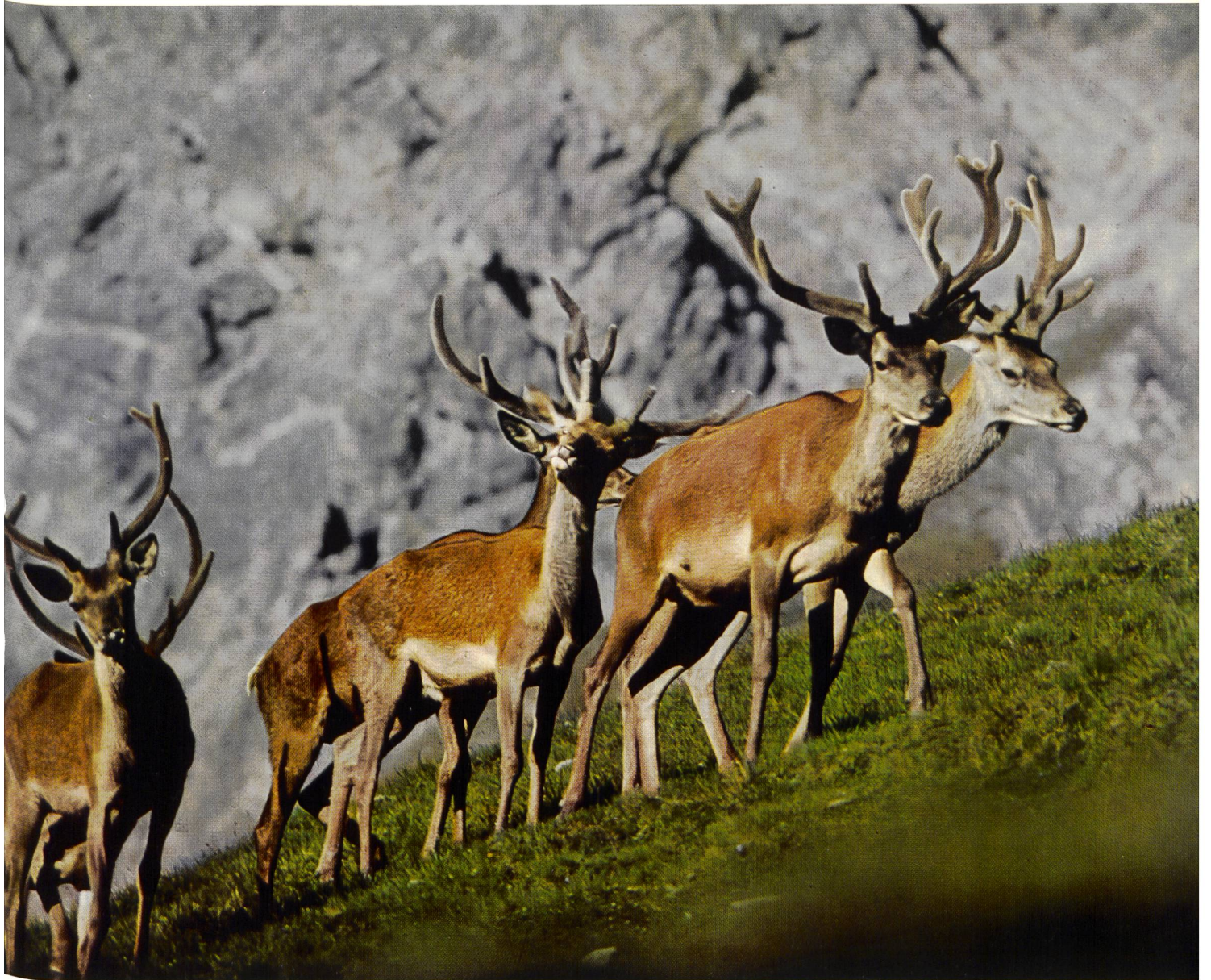
Hirschrudel im Nationalpark.