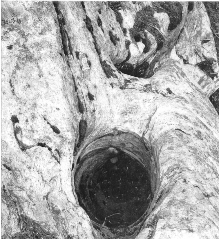
Bild 122 Gletschermühle im anstehenden Granit mit deutlich sichtbaren Schraubengängen

wiederholt sich die strahlende Pracht der Seen von Sils, von Silvaplana und von St. Moritz, geboren aus einem rätselhaften Zusammenwirken der eiszeitlichen Gletscher und der wilden Wasser aus den Seitentälern. Es ist kein Wunder, dass sich durch Jahrzehnte die Freunde einer unverfälschten Bergnatur um ihre Erhaltung bemühten. — Anno 1946 hat der Schweizer Heimatschutz um des wundersamen Silsersees willen den «Schokoladetaler» geschaffen, den entscheidenden Beitrag zur Abgeltung der Besitzergemeinden Sils und Stampa im Bergell geleistet, in der Folge mitgeholfen, sämtliche Masten und Leitungen im Fex tal zu verkabeln und endlich dem Schweizerischen Bund für Naturschutz die Sicherung und den Ankauf der Gletschermühlen-Landschaft auf Maloja ermöglicht.