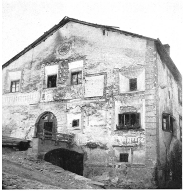
Bild 128 Das Haus Stupan in Ardez von 1676 im alten Zustand (1964)