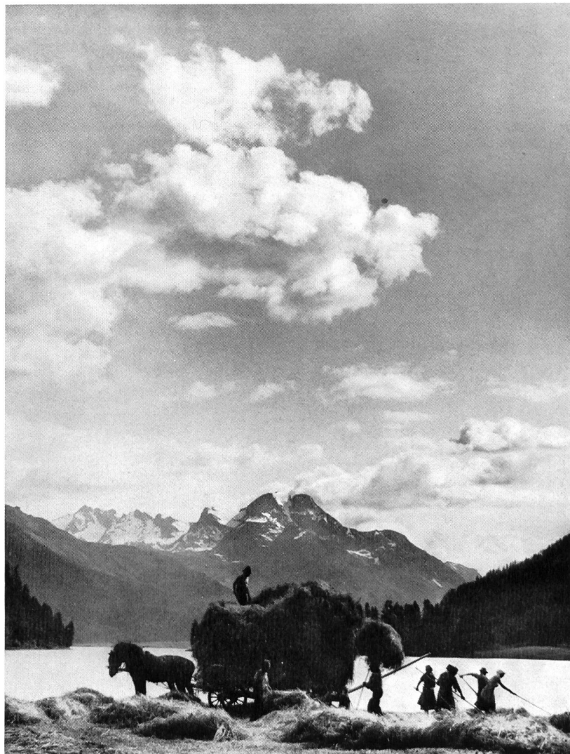
Bild 138 Heuernte am Silvaplannersee; im Hintergrund Piz La Margna