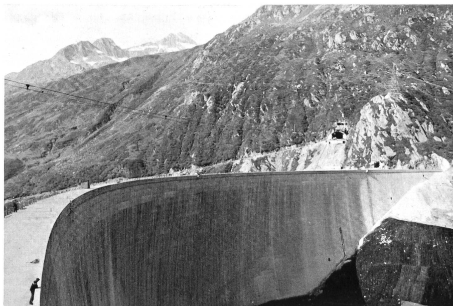
Bild 2 Talseitige Ansicht der Staumauer Sta. Maria am Lukmanierpass, Blick auf Piz Rondadura