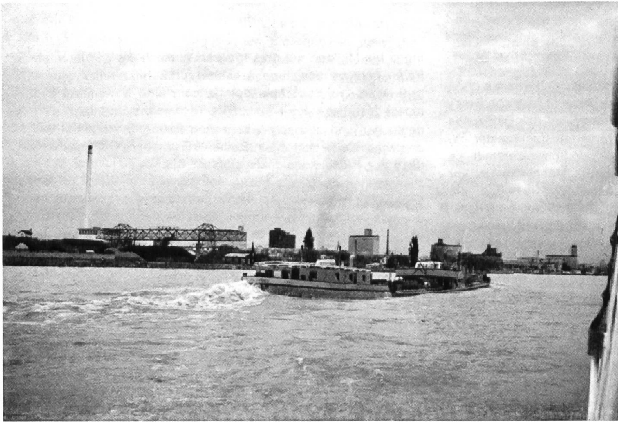
Im Hafен- und Industriegebiet Basels bei Hochwasser führendem Rhein.