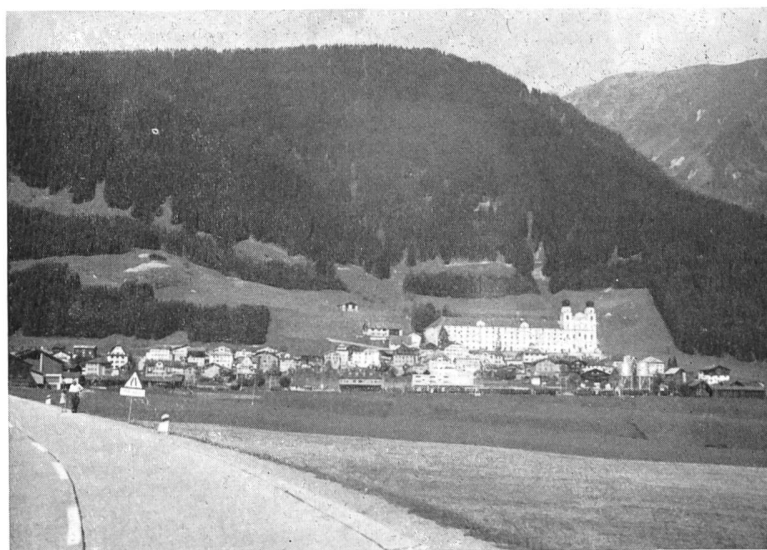
Bild 5 Das die grosse Siedlung Disentis/Mustèr dominierende Benediktiner-Kloster