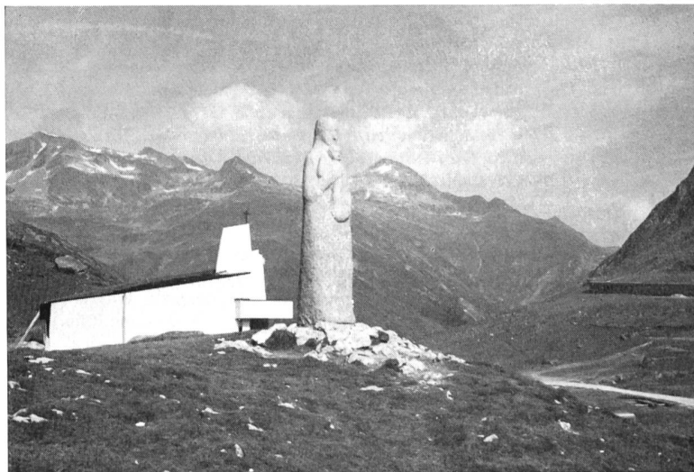
Bild 4 Auf der Passhöhe des Lukmanier wurde durch die KVR neben einer Marienstatue eine kleine moderne Kapelle Sta. Maria errichtet, nachdem die alte Hospizkapelle durch die Schaffung des Stausees Sta. Maria geopfert werden musste.