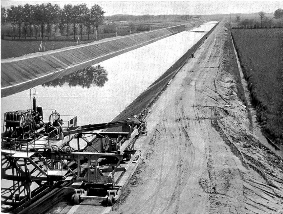
Bild 2 Im Bau stehende Kanalstrecke für die mit raschen Schritten der Verwirklichung entgegen- gehende Binnenschifffahrt in der Po-Ebene.

Die Frachtkosten sind niedrig und die Ladekapazität hoch. Ein grosser Aufwand an Personal ist nicht nötig. Die Ladekapazität eines Schiffes von 1300 Tonnen entspricht beinahe derjenigen von 100 Bahnwagen oder Lastzügen. Die Konferenz der europäischen Transportminister betrachtet ein solches Schiff für die im Interesse Europas liegenden Wasserstrassen als «Normalschiff».