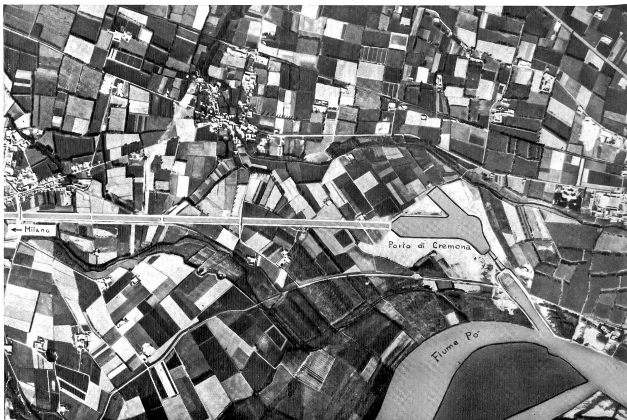
Bild 3 Luftbild der Umgebung der in der Po-Ebene gelegenen Stadt Cremona mit Po, Vorhafen, Schleuse, Hafenbecken und nach Mailand abgehendem Kanal.

Aber auch in anderen Gebieten Norditaliens wird zugunsten neuer Wasserverbindungen gearbeitet. Das Konsortium für die Wasserstrasse Padua — Venedig baut gegenwärtig den 27 km langen Kanal, der die beiden Städte verbinden wird. Gemäss dem Gesetz vom 11. Juli 1913 hat das italienische Parlament folgende Strecken in das Netz der künftigen Wasserstrassen aufgenommen: Turin — Novara — Tessin, Pavia — Melegnano, Acqui — Novara, Tessin — Mailand Nord — Mincio. Am 7. November 1964 hat der «Consiglio superiore dei lavori pubblici» das endgültige Projekt dieses Kanals — «Pedemontano» genannt — genehmigt. Der neue Wasserweg sollte vor allem den Provinzen Ber-