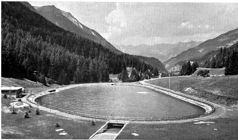
Bild 2 Ausgleichbecken Islas oberhalb Bergün mit 35 000 m 3 Nutzinhalt; Blick talabwärts