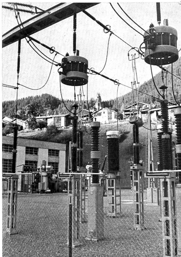
Bild 6 Teilansicht der Freiluftschaltanlage und Zentrale Filisur; im Hintergrund Dorfpforte von Filisur