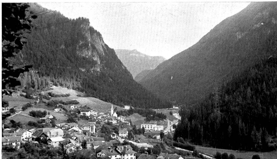
Bild 1 Uebersicht auf Dorf und Kraftwerk Filisur; Blick talaufwärts in das Albulatal

Mit der Bauausführung wurde am 1. November 1961 begonnen, und am 20. November 1965 konnte weitgehend termingemäss der Probetrieb der ersten Einheit der Zentrale Filisur mit dem Wasser aus dem Landwassertal aufgenommen werden. Die zweite Maschinengruppe wurde mit Vorsprung auf das Terminprogramm noch vor Jahresende 1965 ebenfalls in Betrieb genommen. Die Anlagen im