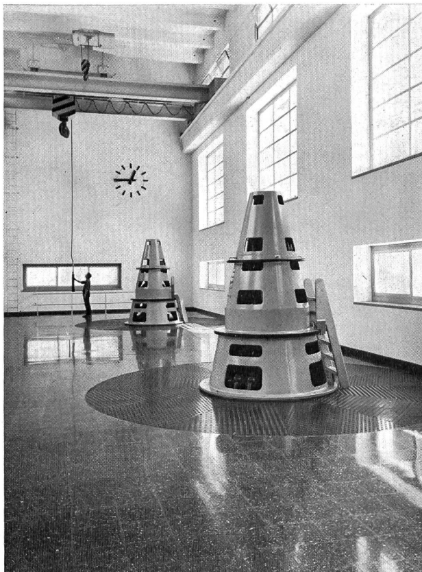
Bild 5 Innenraum der Zentrale