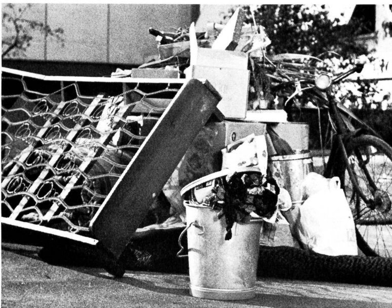
Bilder 3 und 4 (rechts) Die Ueberbleibsel der Wohlstandsgesellschaft fallen der Allgemeinheit zur Last (aus Grotteskfilm «Nur so weiter . . .»).