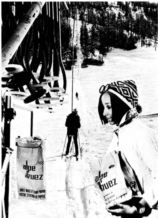
Bild 5 Eine praktische Möglichkeit, auch sportliche Anlagen sauber zu halten und die Abfälle bequem der hygienischen Vernichtung zuzuführen; die Papiersäcke fassen 6 Liter. Für Wohnhäuser, Gewerbebetriebe usw. werden Säcke für 80 Liter Inhalt hergestellt (Photo Firma Promosac, Paris).

Lassen Sie mich zu den die Existenzgrundlagen des Menschen berührenden Fragen über die Sauberhaltung der Landschaft, des Wassers und der Luft einige allgemeine