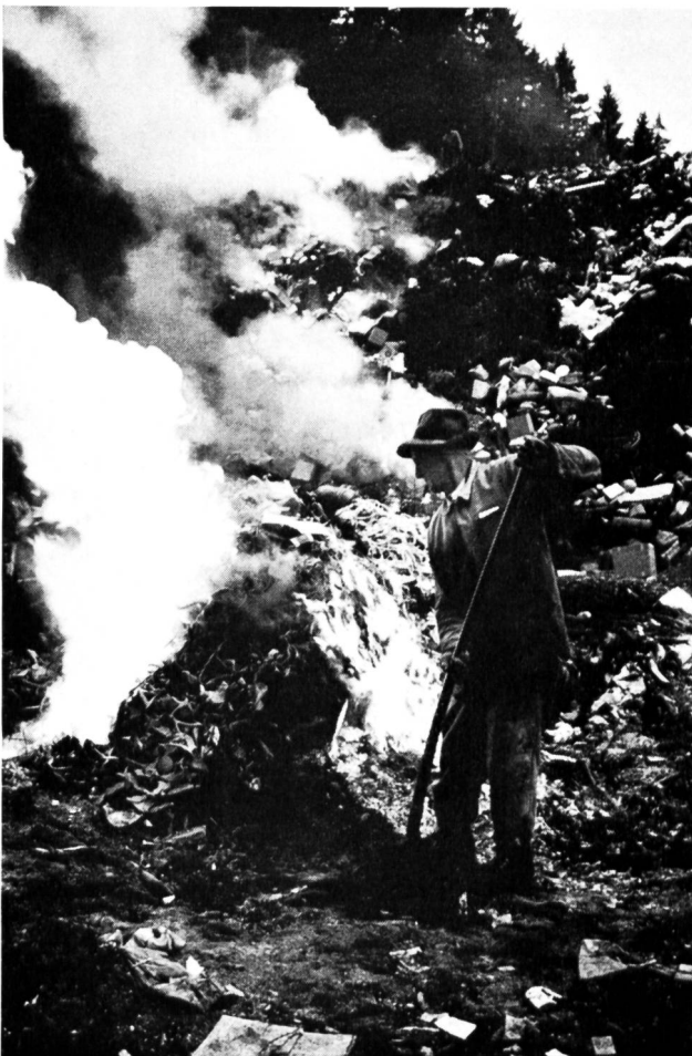
Bild 1 Die wilde Deponie gefährdet unseren Lebensraum durch Gewässerverschmutzung, Ungeziefer, üble Gerüche und Luftverpestung absichtlicher oder ungewollter Brände.

Noch zwei weitere Filme erlebten an diesem Tag ihre Premiere. Sie wurden im Auftrag des bundesdeutschen Ministeriums für Gesundheitswesen gedreht und wenden sich