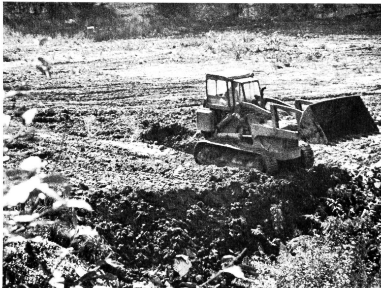
Bild 2 Bei der geordneten Deponie werden Müllschichten bestimmter Höhe mit Erde bedeckt und verdichtet; so können in hygienisch einwandfreier Weise immer neue Schichten aufgebracht werden (aus Dokumentarfilm «Abfall — Schattenseite des Ueberflusses»).

Während der letzten 15 Jahre ist das Volumen des Hausmülls um mehr als 100 Prozent gestiegen, in erster Linie eine Folge des ins Masslose gehenden Verpackungskults, wurden doch allein in der Bundesrepublik Deutschland im Jahre 1951 Verpackungsmaterialien im Gesteuerungswert von