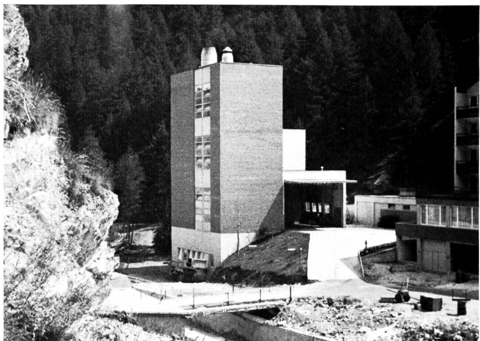
Bild 6 Kehrichtverbrennungsanlage Zermatt ohne Wärmeverwertung. Angeschlossen sind etwa 2800 Einwohner, in der Hoch- saison bis zu 15 000 Personen (aus Dokumentarfilm «Abfall — Schattenseiten des Ueberflusses»).

Es ist schwierig, die zum Teil konkurrierenden, oft noch recht extremen Forderungen der verschiedenen Disziplinen zu volkswirtschaftlich sinnvollen, aber umwelthygienisch einwandfreien Lösungen zu führen, denn Verbote ohne entsprechende Gebote können den Zweck nicht erfüllen. Um dieses Ziel zu erreichen, sind neben einer Intensivierung