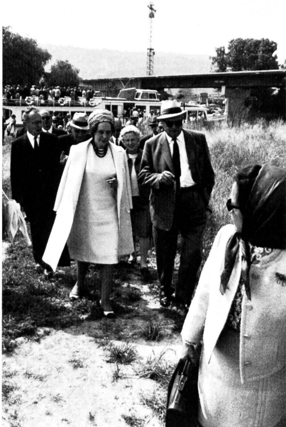
Bild 9 Umsteigen am Zihlkanal vom Schiff in die Autocars