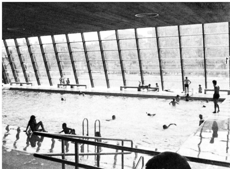
Bild 2 Das Schwimmbad im Kongressgebäude von Biel