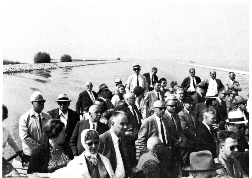
Bild 7 Einfahrt vom Neuenburgersee in den Zihlkanal