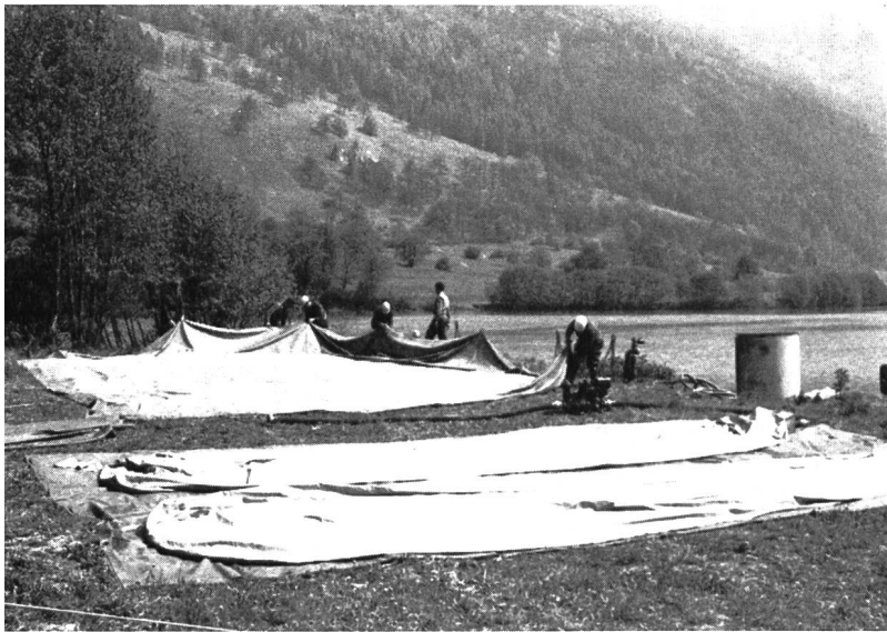
Bild 1 Aufbau der wasserdichten Blachen für die Einleitung des im Fluss abgesaugten Oel/Wasser-Gemisches; im Vordergrund zwei lange Stoffbehälter für den Abtransport des abgeschöpften Oels mittels Camions