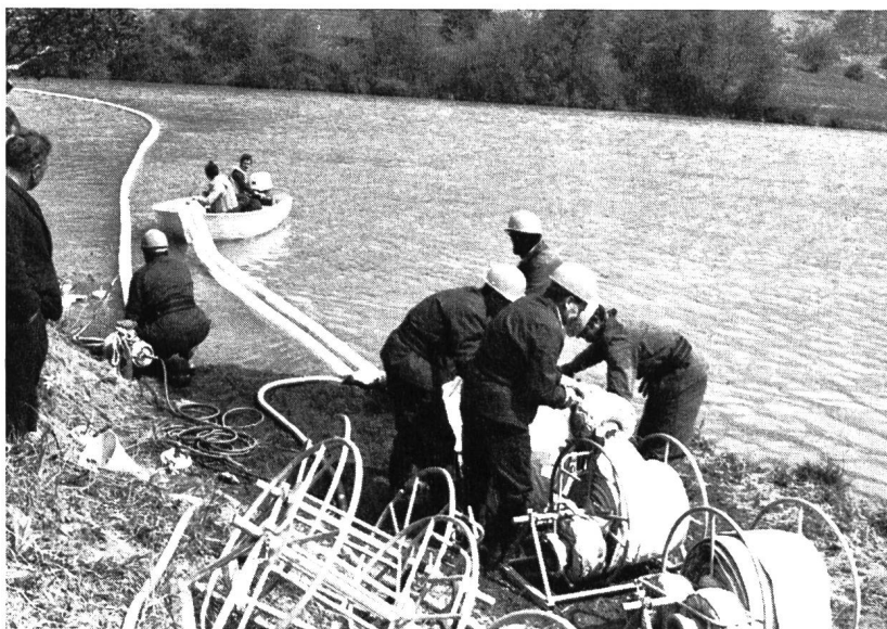
Bild 4 Verlegen der zweiten Schlauchleitung