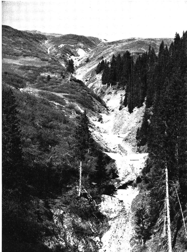
Bild 6 Oberster Teil der Verbauung im Platzertobel, Gemeinde Safien, ausgeführt Sommer 1969

Seit Beginn dieses Jahrhunderts bis anfangs 1970 sind im Einzugsgebiet des Vorderrheins für Fr. 23 068 000 Verbaubarbeiten ausgeführt worden. In dieser Summe sind die von der Rhätischen Bahn auf der Strecke Reichenau — Illanz ausgeführten Bewehrungen nicht enthalten. Ebenso sind die ca. 1,1 km langen Wuhre zum Schutze der Zentrale und Freiluftanlage bei Tavanasa, die durch die Kraftwerke