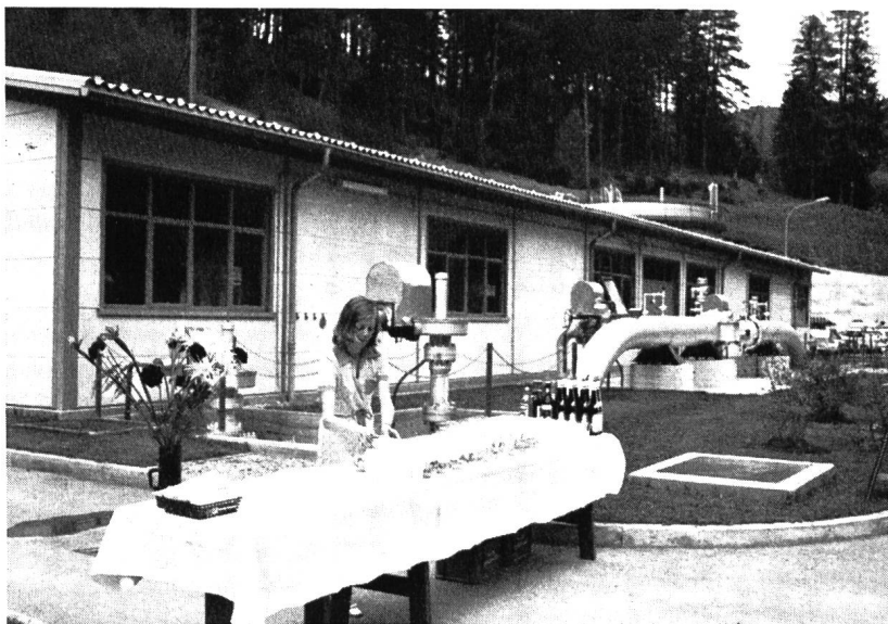
Bild 5 Teilansicht der Druckreduzier-Station Rongellen