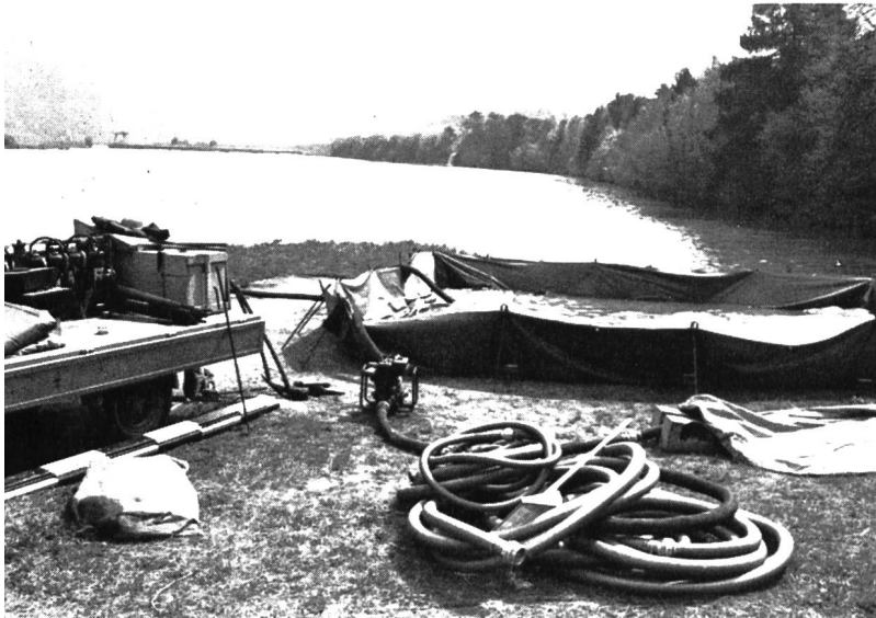
Bild 2 Aufgestellter Notbehälter während des Hineinpumpens der aus dem Rhein entnommenen Flüssigkeit