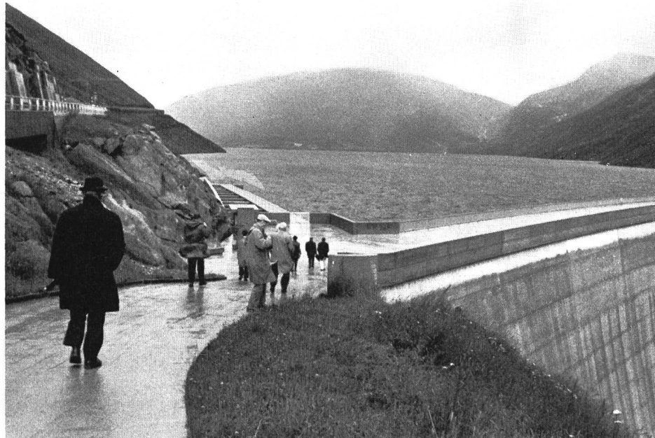
Bild 5 Blitzbesuch von Talsperre und Stausee Sta Maria am Lukmanierpass bei böigem Regen

quickende Wärme im neuen Hospiz auf der Passhöhe vorgezogen. Auch bei den Zentralen wird auf Aussenbesichtigungen verzichtet.