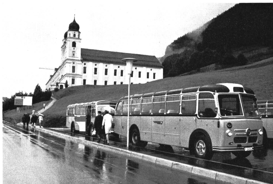
Bild 6 Der anhaltende starke Regen vereitelt den Nachmittags- besuch der Talsperren Curnera und Nalps, so dass schliess- lich ein Grossteil der Exkursionsteilnehmer den Besuch des Klosters Disentis vorzieht