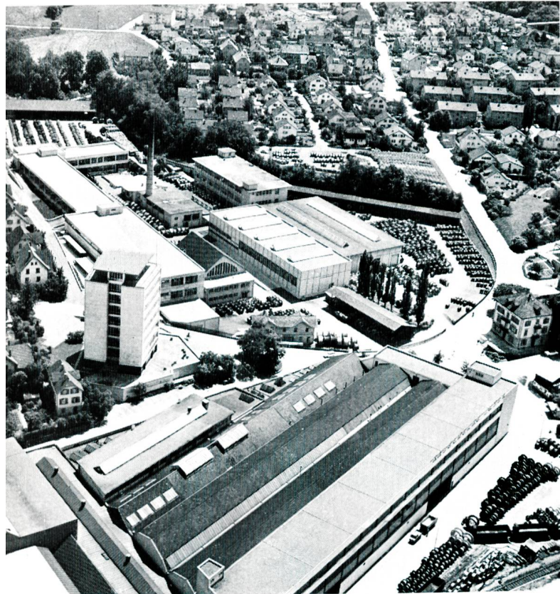
Bild 1 Gesamtansicht des Fabrikkomplexes der Kabelwerke. Typisch für dieses Unternehmen sind die ausgedehnten Rollenlager auf dem Betriebsareal.

Grosse Rohr- und Korbverseilmaschinen dienen dazu, die Drähte zu Drahtseilen zu verseilen. Diese Maschinen gehören zu den modernsten und leistungsfähigsten, die in Drahtseilfabriken zum Einsatz gelangen. Es werden Drahtseile für Krane, Bagger und Bergbahnen aller Arten hergestellt. Besonders eindrücklich ist die Fabrikation von verschlossenen Trageilen für Personen-Luftseilbahnen und von Förderseilen für Gondelbahnen auf zwei grossen Korbverseilmaschinen. Auch Seile für Hochspannungs-Freileitungen werden auf Korbverseilmaschinen hergestellt. Die sogenannten Hanf- und Kunststoffseelen für die Mittelstücke der Drahtseile verseilt und imprägniert man im eigenen Werk.