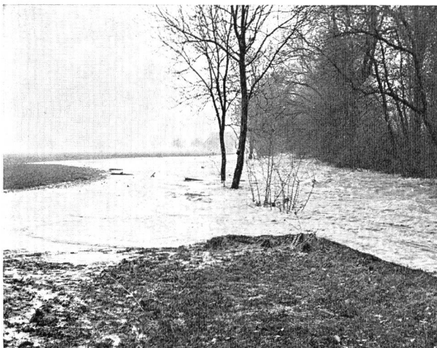
Bild 2 Ueberschwemmung in der Gemeinde Brittnau.

schnitt. Um durch die grösseren Wassergeschwindigkeiten das Gerinne nicht zu beschädigen, müssen die Ufer bis auf 1,50 m ab Sohle mit Steinblöcken gesichert werden. Die Sohle muss durch Schwellen aus Rundholz bzw. Beton und mittels einer Sohlenabsicherung aus gebrochenen Steinen fixiert werden. Dank der Sohlenabsenkung und dem erhöhten Längsgefälle kann der maximale Hochwasserabfluss durchgehend 60 bis 80 cm unter dem angrenzenden Gelände gehalten werden. Es ist somit eine sichere Entwässerung des Umgeländes zu jeder Zeit gewährleistet. Ebenso können durch diese Massnahmen die noch vorhandenen Wassermatten in der Gemeinde Brittnau erhalten bleiben.